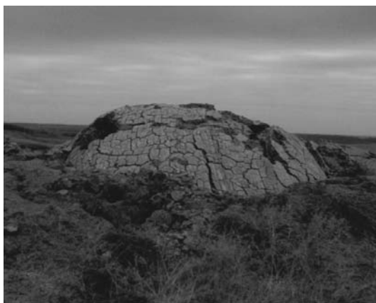
Рис. 4. Вулкан Краснооктябрьский. Фото 2005 г.

наблюдается высокое содержание обломочного карбонатного материала, буквально устилающего брекчию более крупными обломками, много обломков кальцитовых жил с сульфидами. В этой связи о приуроченности грязевого вулкана Школьный-1 к меловым отложениям приходится говорить лишь предположительно.