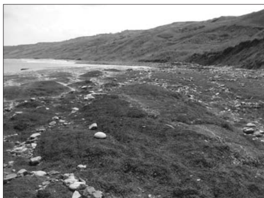
Рис. 6. Выпирание грунтов у мыса Каменный. Фото 2011 г.