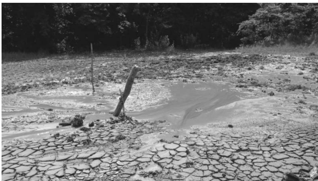
Рис. 2. Грязевой вулкан Школьный-1, сальза

Контакт выражен не ясно. Отмечается проявление стратиграфического и тектонического несогласия. Блочное строение обусловлено проявлением надвиговых нарушений.