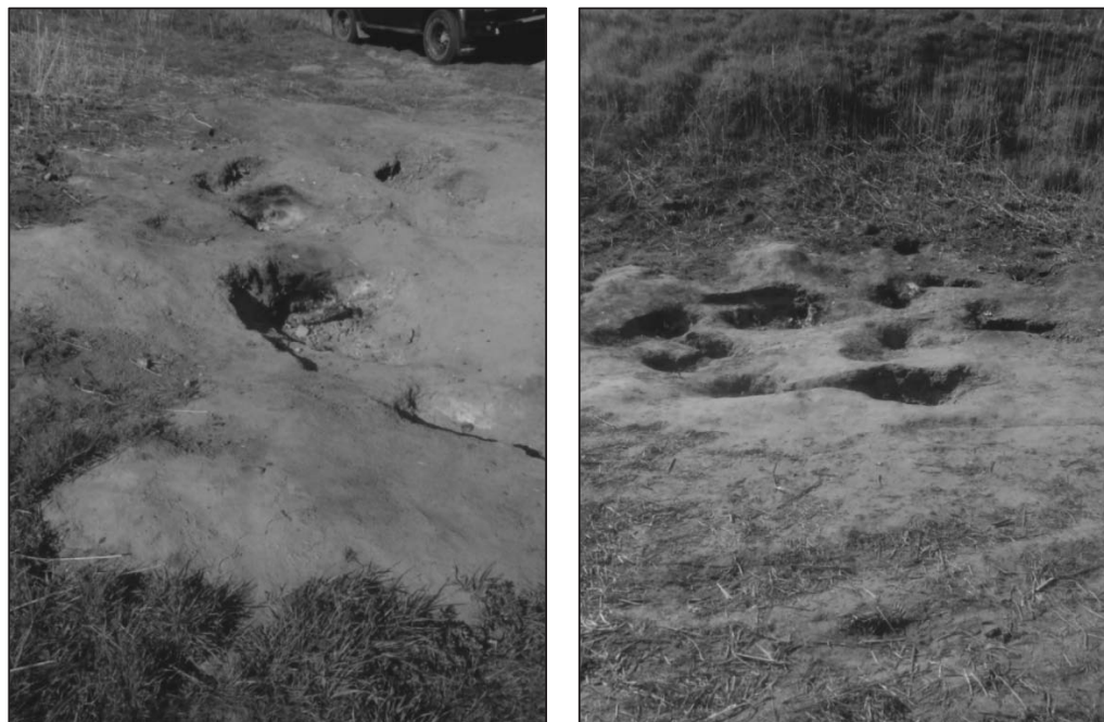
Рис. 5. Газовые факелы на Курчанском вулкане. Фото 2014 г.