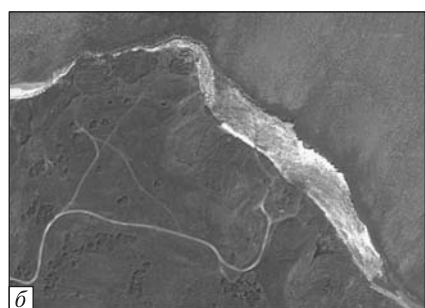
Рис. 7. Вид на мыс Каменный до и после выпирания грунтов ▶

Как видим, в данном случае нет грязевой брекчии. Объяснением данного факта может быть отсутствие в разрезе водонасыщенных горизонтов на пути газового проникновения. Согласно И.М. Губкину такие явления наблюдаются там, где вулканы развиты на выходах майкопских глин. В 2011 г. у мыса Каменный в результате внезапного выброса газов произошло выпирание грунта в районе пляжа и прилегающего подводного склона (рис. 6). При обследовании было обнару-