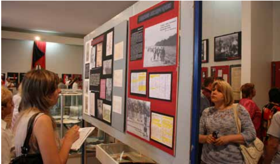
Фотовиставка “Зламані долі. Комуністичний терор в Україні 1920–1950-х років”. Вінниця.

тридцятих-сорокових роках ХХ століття. Невідомі документи з архівів спеціальних служб”.