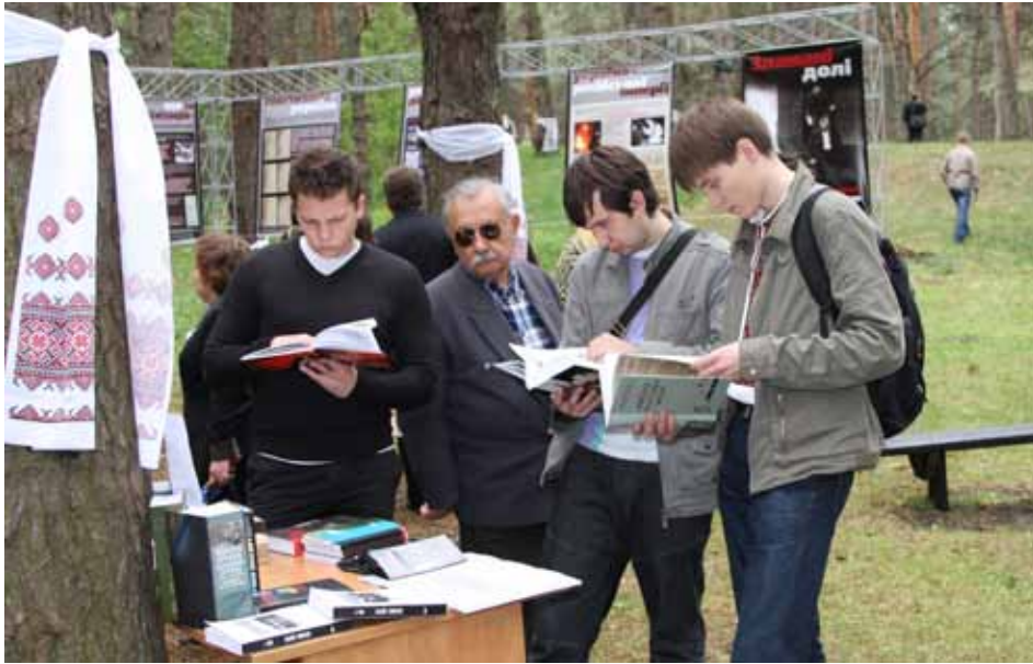
Фотовиставка “Зламани долі. Комуністичний терор в Україні 1920–1950-х років”. Київ. Меморіальний комплекс “Биківнянські могили”.

світової війни”*. Метою проекту є формування централізованої бази даних на радянських військовополонених за архівними документами європейських країн – учасників Другої світової війни.