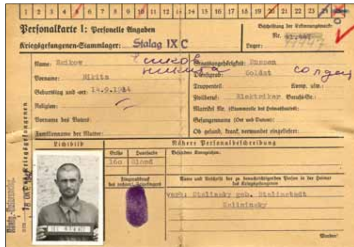
Облікова картка в'язня німецького табору для військово-полонених.

– документи радянської карально-репресивної системи (комуністичний терор, голодомори, депортації та переселення);