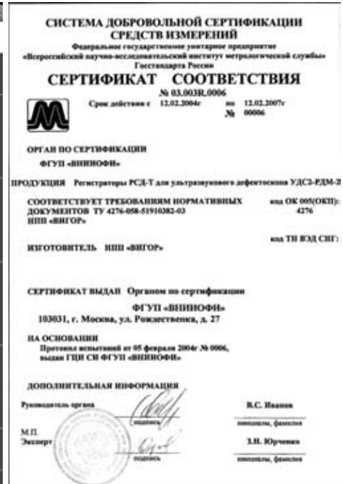
Рис. 2. Сертификат соответствия

Документирование результатов ультразвукового контроля рельсов съемными дефектоскопами типа УДС2-РДМ-2 , оснащенными регистраторами РСД-Т , расширяет возможности контроля, позволяет проводить проверку правильности настройки дефектоскопов, а также контроль работы операторов дефектоскопов, повышает ответственность операторов за результаты контроля, а значит, позволяет существенно повысить надежность и достоверность обнаружения дефектов в рельсовом пути.