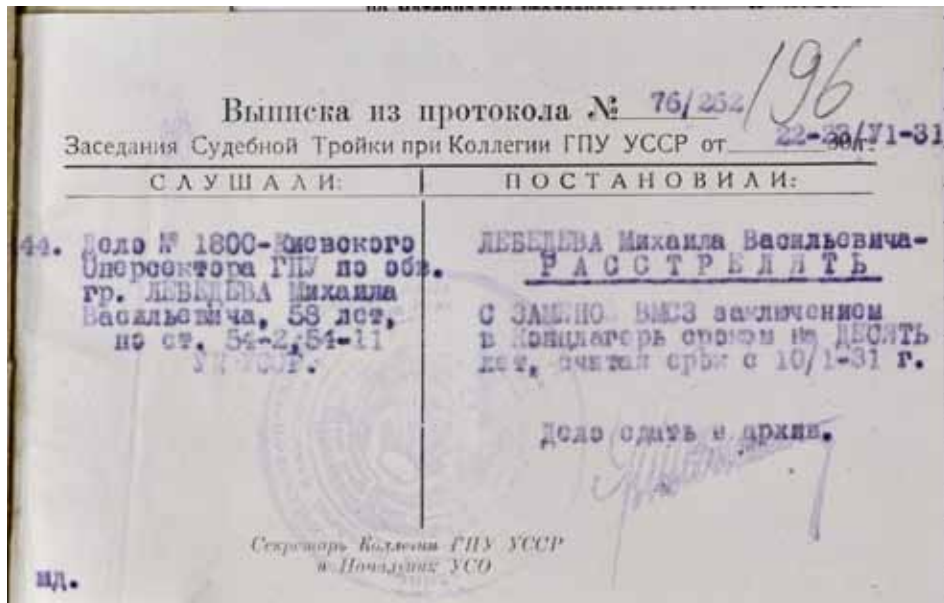
Ф. 6, спр. 67093-ФП-Т.2417, арк. 196.

сонській виправно-трудо́вій промисло́вій колонії. Завдяки клопотанням керівництва установи у 1933 році термін покарання було скорочено до 5 років, і К.В. Гаєвський був звільнений достроково) 6 .