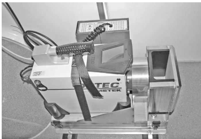
Рис. 3. Переносний детектор/ідентифікатор нуклідів на основі особливо чистого германію марки ORTEC

Додаткове повітря, що втягується пробовідбірниками, створює надмірний тиск, який перешкоджає просочитися в салон забрудненому повітрю крізь нещільно закриті двері та вікна.