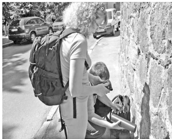
Рис. 7. Обстеження території за допомогою переносних приладів

За результатами проведених вимірювань, під час чергувань мобільної лабораторії RanidSONNI інцидентів з незаконним застосуванням джерел іонізуючого випромінювання не сталося, радіаційна обстановка на визначених маршрутах знаходилася в межах «нульового фону». Поодинокі сплески гамма-випромінювання були пов'язані з появою в місцях скупчення людей осіб, які приймали радіофармацевтичні препарати на кшталт фтору-18 (дане ДІВ чітко визначалось за допомогою парку приладів радіаційного контролю RanidSONNI). У кількох випадках ідентифікувалися промислові ДІВ (америцій-241), що пов'язано із знаходженням в місцях, де проводилися виміри, спеціалізованих автомобілів, на борту яких знаходилися прилади, в яких використовуються промислові ДІВ.