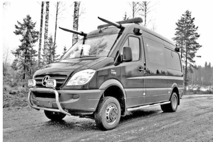
Рис. 1. Машина радіаційної розвідки RanidSONNI

Технічне оснащення мобільної радіологічної лабораторії RanidSONNI. RanidSONNI — це сучасна модель машини для виконання радіологічних вимірювань (рис. 1), призначена для виявлення та аналізу потенційних радіологічних та ядерних загроз, таких як викид радіоактивних матеріалів з об'єктів ядерно-паливного циклу, що призвів до забруднення радіоактивними речовинами довкілля. Універсальна МРЛ оснащена високоякісним сучасним