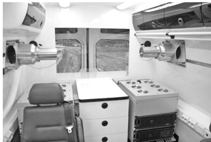
Рис. 2. Сцинтиляційні детектори (NaI) з 180-градусним полем огляду

Машина оснащена двома стаціонарними пробовідбірниками. Фільтри розміщені в пластикових касетах, що полегшує роботу з пробами в машині, під час руху. Завдяки особливій конструкції касети з фільтрами проводити підготовку проб перед вимірюваннями немає потреби. У сильно забруднених районах відфільтроване повітря із стаціонарних пробовідбірників може подаватися до салону.