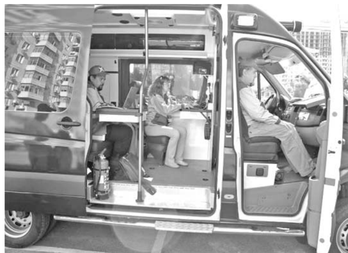
Рис. 6. Екіпаж лабораторії готується до виїзду

Радіаційне обстеження проводилось щоденно, включаючи вихідні та святкові дні, двічі на добу. Зранку територія обстежувалася вздовж периметра фан-зони за допомогою переносних спектрометрів (перевірялися місця можливого знаходження джерел іонізуючого випромінювання — припарковані поблизу автомобілі, контейнери для сміття тощо), у другій половині дня — територія самої фан-зони після її відкриття. Крім