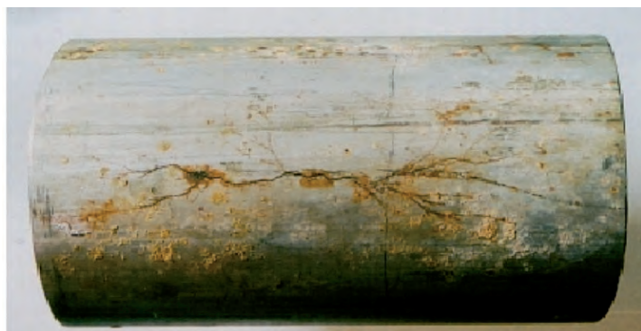
Коррозионное растрескивание под напряжением трубопровода из нержавеющей стали 316L.