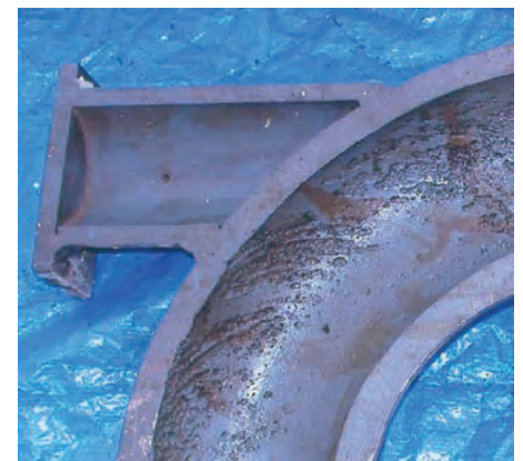
Общая коррозия (под влиянием потока).

трещин, растрескиванию, а в итоге к разрушению детали. Использование сталей, содержащих такой легирующий элемент, как хром, который имеет стабилизирующий эффект на карбиды железа, может эффективно предотвращать ВК. Имеются документально подтвержденные случаи, когда ВК приводила к катастрофическому разрушению детали из низколегированной стали из-за неправильной ее установки. Ранее считалось, что абсолютно чистая вода не является источником коррозии, однако установлено, что при определенных условиях она может приводить к механизму, известному как Ускоренная Поток Коррозия (УПК). С этим столкнулись, прежде всего, в энергетической промышленности, где часто сталкиваются с ультрачистой водой и паром. Факторы, способствующие увеличению УПК, комплексные, но существенным является процесс, когда горячая вода или пар с низким содержанием кислорода протекает по трубе из углеродистой стали, и, как правило,