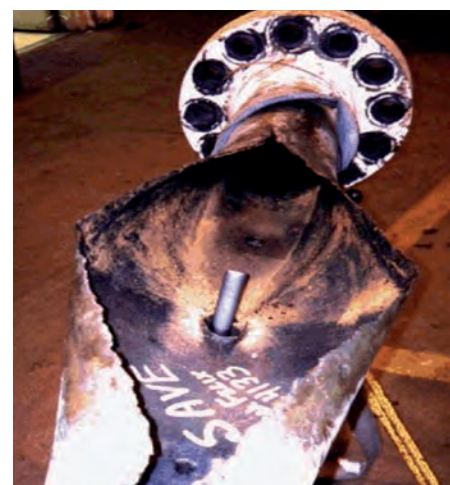
Коррозия от химката при производстве кислоты (ингибитор образования накипи).