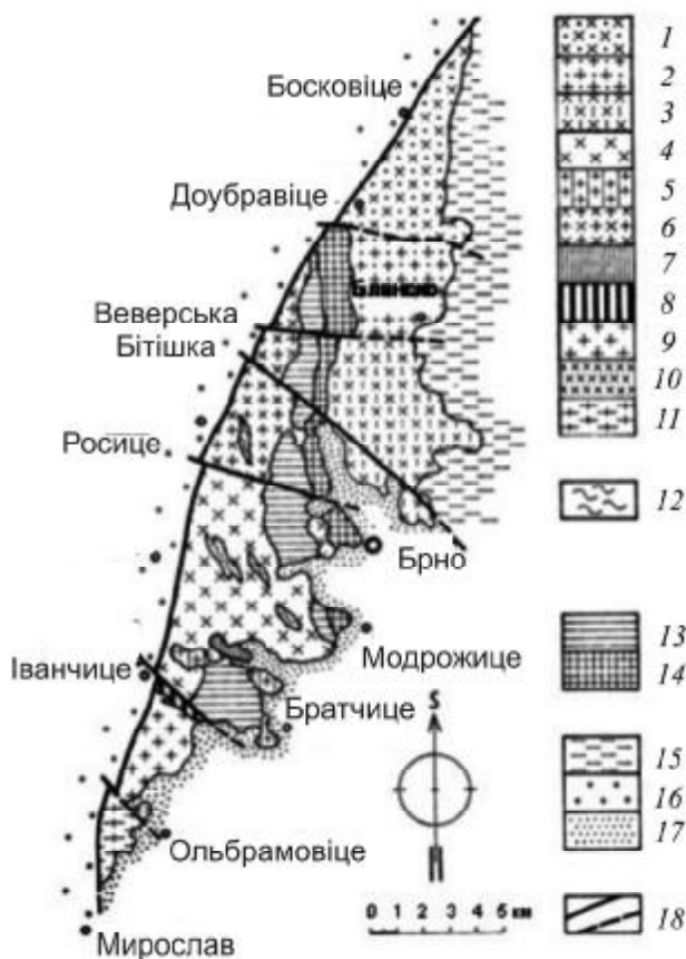
Рис. 1. Схематична геологічна карта Брненського масиву [13]. Петрографічні типи гранітоїдів (1–11): 1 – Доубравіце, 2 – Бланско, 3 – Кралово Поле, 4 – Тетчице, 5 – Коуніце, 6 – Веверська Бітішка, 7 – Глина, 8 – Рена, 9 – Крумловський Ліс, 10 – Ведровіце, 11 – Ольбрамовіце; 12 – мігматити, амфіболіти, гнейси, кварцити, діорити; 13 – метадіоритова субзона; 14 – метадіабазова субзона; 15 – середньоморавський палеозой; 16 – пермокарбон Босковицької борозни; 17 – неоген Карпатського прогину; 18 – розривні порушення

джен еволюційних змін середнього вмісту відповідних асоціативних груп хімічних елементів через відповідні значення індикаторних відношень їх середніх кларків концентрацій. Найменування геохімічного типу провідних петротипів гранітоїдів визначали за назвою тих асоціативних груп елементів, величини усереднених КК яких були більші за кларкові. Якщо КК цих асоціацій елементів у петротипах дорівнювали або були менші за кларковий рівень, приналежність їх до відповідних геохімічних типів вважали умовною і враховували при цьому значення КК тих двох асоціативних груп елементів, величини яких були найбільші. Для лаконічної характеристики ступеня спеціалізації порід використані такі умовні значення КК хімічних елементів: 1 < \text{КК} < 1,5 – геохімічна спеціалізація умовна; 1,5 \leq \text{КК} < 3,0 – ймовірна; 3,0 \leq \text{КК} < 9,0 – явна. Назви петрографічних видів гранітоїдних порід Брненського масиву наведені відповідно до рекомендацій [4].