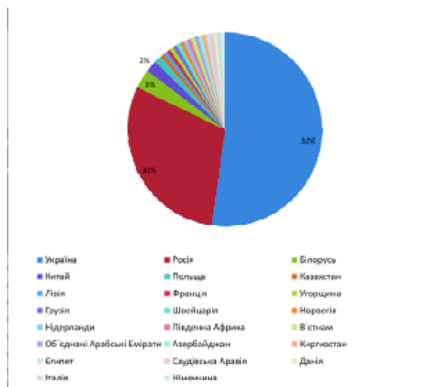
Географія конференції “Geoinformatics 2011”

Секційні засідання відбувались у трьох конференц-залах. У четвертому залі працювала студент-