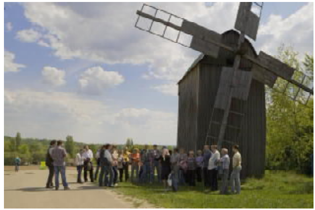
Екскурсія в Музей архітектури та побуту

Проектом рішення конференції ухвалено при підготовці наступної конференції виділити як пріоритетні такі напрями: управління геоданими та створення інтегрованих геологічних баз даних; нафтогазопошукові технології – нові напрями та перспективи; дистанційне зондування Землі та ГІС. В організаційному плані запропонована