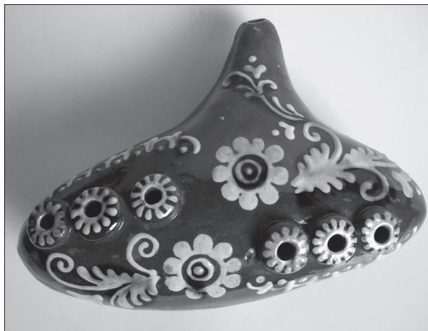
Розалія Ілюк. Окарина. Глина, формування на гончарному крузі, ліплення, проколювання (6 пальцевих отворів), лискування, димлення. h—18 см. Косів, Івано-Франківська обл. 1988 р. КН-2558/№ 974, КМНМПП.

Теракотові свистунці у вигляді птахів, які продавалися у крамницях та на ярмарках північної та цен-