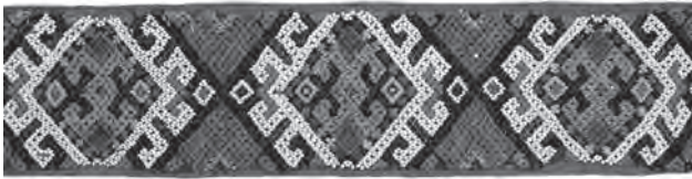
Іл. 2. Яворська М.І. Гердан стрічковий «герданик». Бісер, нитки, нанизування «сіточкою». Фрагмент. 1920-ті рр., с. Веречанка Заставнівського р-ну Чернівецької обл. ЧОДМНАП, ПР-30