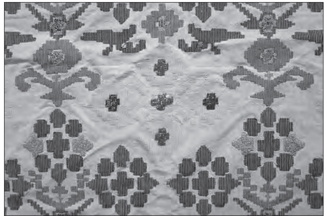
Іл. 8. Намітка «рушник». Лляні та бавовняні нитки, перебірне ткання, бісер, вишивання «півхрестиком». Фрагмент. Перша половина ХХ ст., с. Мосорівка Заставнівського р-ну Чернівецької обл. ПМА за 26 червня 2007 р.