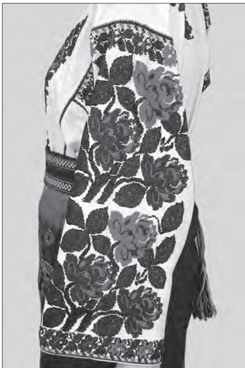
Іл. 11. Сорочка тунікоподібна жіноча додільна «плечиками та рукавами». Полотно, бісер, січка, вишивання «півхрестиком». Кінець 1930-х рр., с. Самушин Заставнівського р-ну Чернівецької обл. ЧОХМ, Т-1190 (Експозиція)