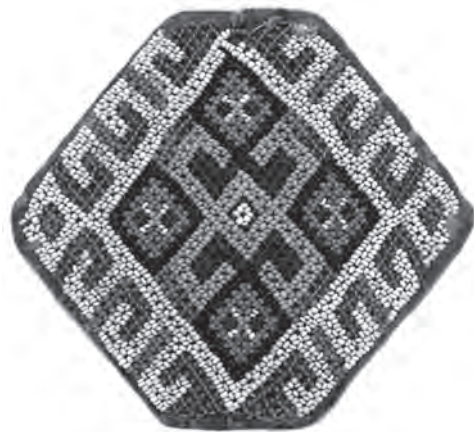
Іл. 6. Квітка. Бісер, нитки, нанизування «сіточкою». 1920-ті рр., с. Веренчанка Заставнівського р-ну. ЧОДМНАП, ПР-36

формотворчі можливості нових технік, особливо ткання. Проте, ткання позбавило технічний орнамент 4 прикраси такого важливого (притаманного нанизуванню) засобу художньої виразності як ажурність. Тому, щоб урізноманітнити декоративну структуру бісерної прикраси, щонайбільше розеткового гердану, буковинські майстри застосовували одночасно із тканням (основні орнаментальні площини) техніку