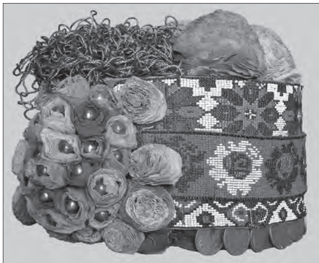
Іл. 7. Вакарюк М.І. Весільний вінок «капелюшиння». Картонний корпус, нитки, бісер, тканиня. 1920-ті рр., с. Брідок Заставнівського р-ну Чернівецької обл. ЧОХМ, Т-102

набирання в разки або нанизування (проміжки між основними орнаментальними площинами) [18].