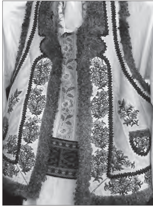
Іл. 18. Кептар. Вибілена шкіра, сірий смушок, січка, бісер, вишивання. Середина ХХ ст., с. Топорівці Новоселицького р-ну Чернівецької обл. ЧОКМ, III-18938 (Експозиція)

При вишиванні кептарів використовували дещо крупнішу (№ 11, 10), аніж при вишиванні сорочок, січку різних гатунків, що впливало на масштаб мотивів. Часто елементи мотивів виконували застосо-