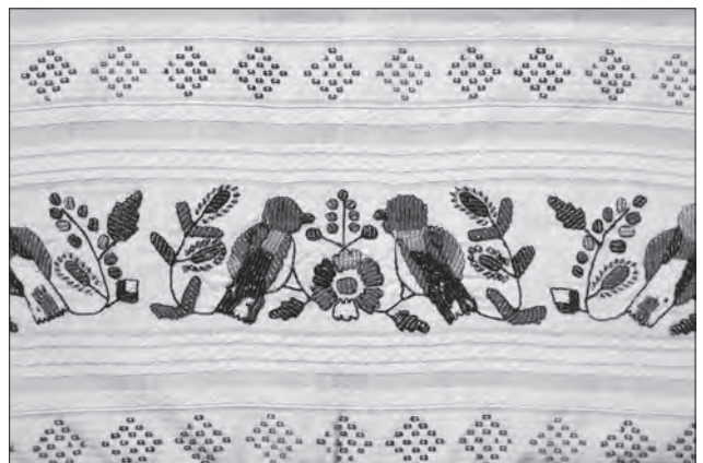
Іл. 9. Намітка «рушник». Лляні та бавовняні нитки, перебірне ткання, бісер, вишивання «уперед голкою» та «вільною гладдю» (бісер), «стебнівкою» (нитки). Фрагмент. 1930-ті рр., с. Діброва Кіцманського р-ну Чернівецької обл. ЧОДМНАП, КВ-6244