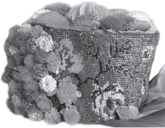
Іл. 4. Весільний вінок «коди». Картонна основа, полотно, січка, вишивання. 1970—1980-ті рр., с. Погорілівка Заставнівського р-ну Чернівецької обл. ПМА за 2007 р.