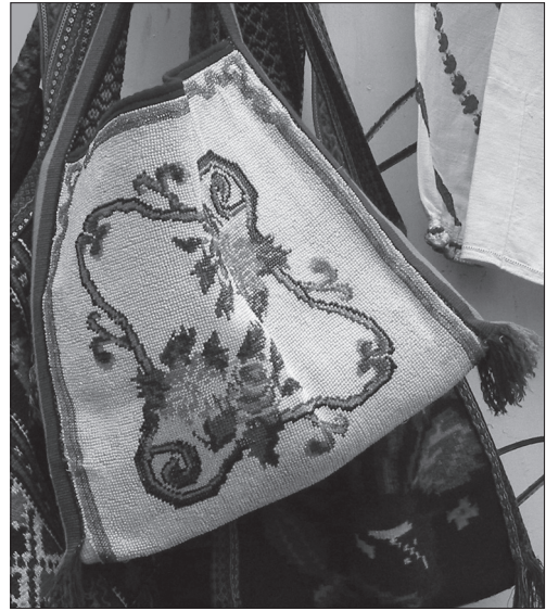
Іл. 12. Тайстра. Платно, бісер, січка, вишивання півхрестиком. 1980-ті рр., с. Топорівка Новоселицького р-ну Чернівецької обл. Львівський вернісаж. Літо 2013 р.

Характерологічною ознакою буковинської сорочки стали рослинні мотиви великих розмірів, що надали загальній композиції твору досі не типової монументальності. Серед вишитих бісером композицій найбільшого поширення набули стилізовані рослинні мотиви з геометризованими формами, яким за ра-