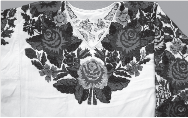
Іл. 8. Сорочка жіноча тунікоподібна додільна. Фрагмент нагрудної вишивки. Полотно, січка, бісер, вишивання півхрестиком. 1970-ті рр. Кіцманський р-ну Чернівецької обл. ПМА за 2008 р.