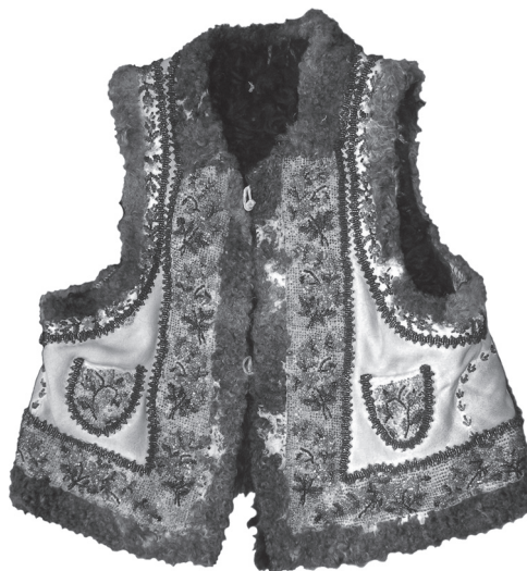
Іл. 10. Кептар «кожушина з цятками». Шкіра, січка, вишивання півхрестиком, стебловим швом, вільною гладдю. 1965 р., с. Топорівці Новоселицького р-ну Чернівецької обл. ПМА за 2007 рік

«подолка». Її вбирали одночасно із сорочкою «станком». Спід «підьтічки» майстри прикрашали стрічковим орнаментом, вишитим бісером (січкою). На Буковинському Поділлі «підьтічку» підточували бісерною «корункою». З 1980-х рр. бісерні мережива стали з'являтися й на новоселицьких «подолках». Декор «підьтічки» та нижньої частини додільної сорочки (в якій «станок» і «підьтічка» становили єдине ціле) були ідентичними [5, с. 550].