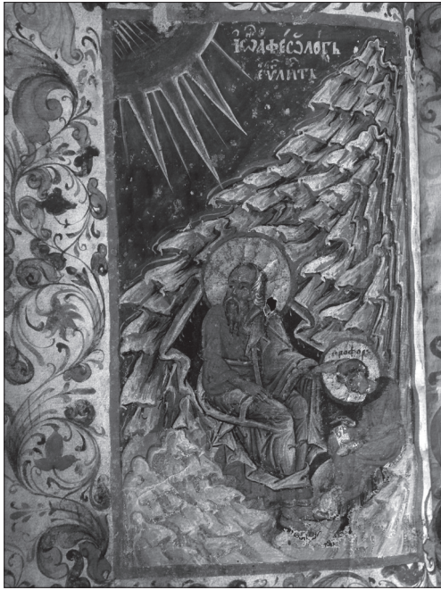
Євангеліє Хишевичівське, 1546 р. Мініатюра «Євангеліст Іван»

ресопницького Євангелія Михайлом Василевичем зі Сянока та анонімним автором врат з Сушиці [10, с. 27]. Фрагмент царських врат з Сушиці Великої є важливою пам'ятка для вивчення мініатюр українських рукописів того періоду.