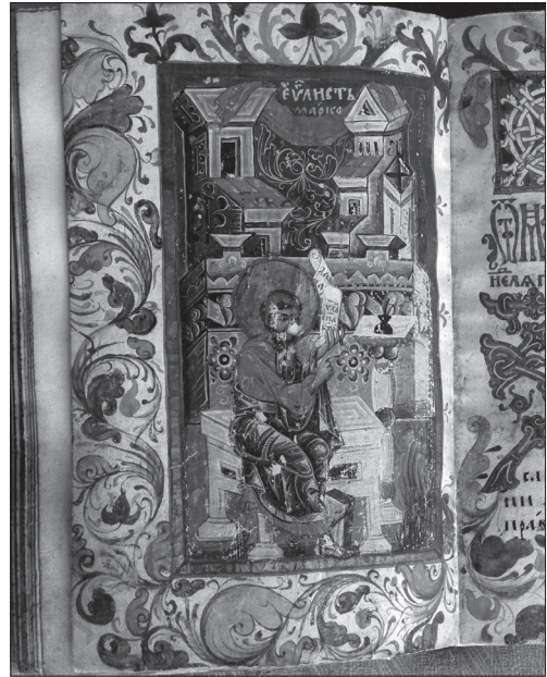
Євангеліє Хишевичівське, 1546 р. Мініатюра «Євангеліст Марко»

Іконопис, монументальне малярство та книжкова мініатюра того часу розвивалися в одному стилістичному руслі. Порівнюючи пам'ятки, доходимо висновку, що одні й ті ж майстри працювали в різних видах малярства. Яскравий приклад цьому подає мі-