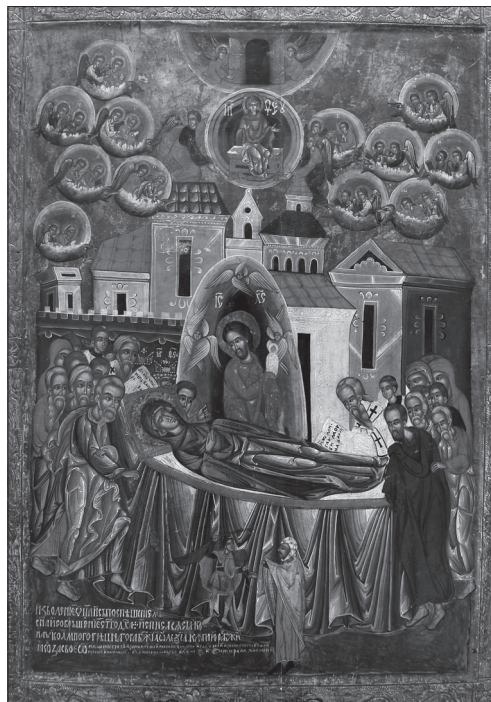
Майстер Олексій. Ікона «Успіння Богородиці», 1547 р. з церкви Успіння Богородиці с. Смільник

До цього кола віднесено ікони з церков в Ільнику, Бусовиськах, Малнові, Ванівці. Володимир Александрович ідентифікує майстра Олексія з виявленим у документах Перемиського міського архіву пізнішого часу малярем Олексієм Горошковичем. Однак, аргументи дослідника не достатньо переконливі [1]. 6