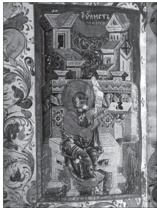
Євангеліє Хишевичівське, 1546 р. Мініатюра «Євангеліст Лука»

ніатюрне письмо на збереженому фрагменті царських врат середини XVI ст. з Сушиці Великої [8, с. 852—853]. Їх живопис без сумніву видає руку мініатюриста. Свого часу дослідник Михайло Драган звернув увагу на спорідненість орнаментики, що обрамлює іконописне зображення цих врат, з орнаментикою Пересопницького Євангелія. Вчений висловив припущення про контакти між писарем Пе-