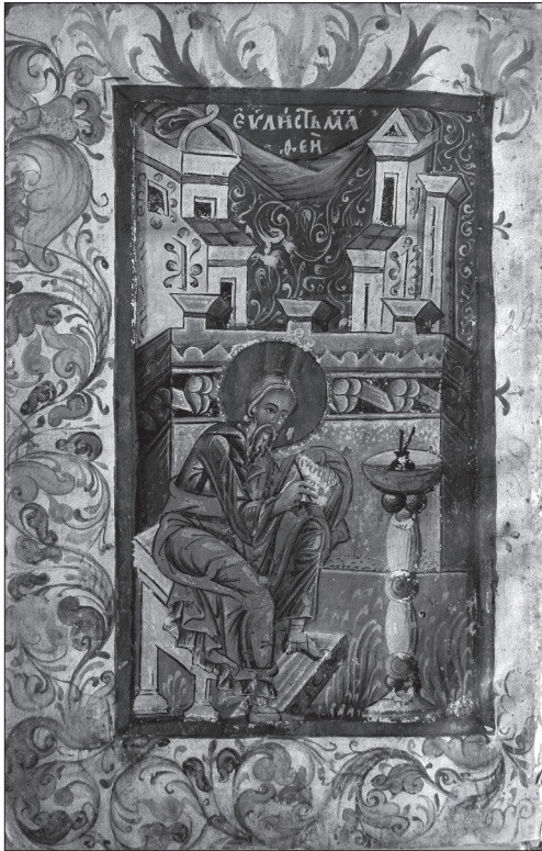
Євангеліє Хишевичівське, 1546 р. Мініатюра «Євангеліст Матвій»

ноєвропейським мистецтвом [12, с. 79]. Я. Запаско акцентував увагу на своєрідності оздоблення Євангелія з Хишевичів, вважаючи, що найцікавішим у ньому є рослинні обрамлення, яким прикрашені початкові сторінки окремих Євангелій і поля навколо зображень євангелістів. Натомість у дослідженнях майже не йшлося про фігуративні композиції; вони не аналізувалися у контексті українського малярства того часу.