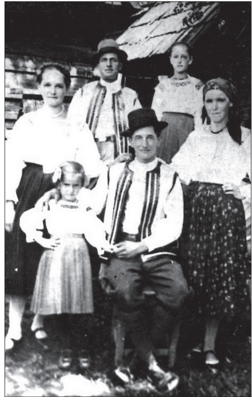
Великобичківська родина. Початок ХХ ст.

Звичайно, пошиттям одягу займались в основному жінки. Вони шили вбрання для всієї родини. Це була досить важка робота. «Її може робити лише така витривала у праці жінка, якою є гуцулка» [13, с. 216]. Гуцули намагались залучати до роботи дітей. Дівчаток змалечку вчили прясти, вишивати. Залучення дитини до виконання певних робіт у гуцулів вважалось важливим фактором формування особистості. Дитина, яка постійно допомагала бать-