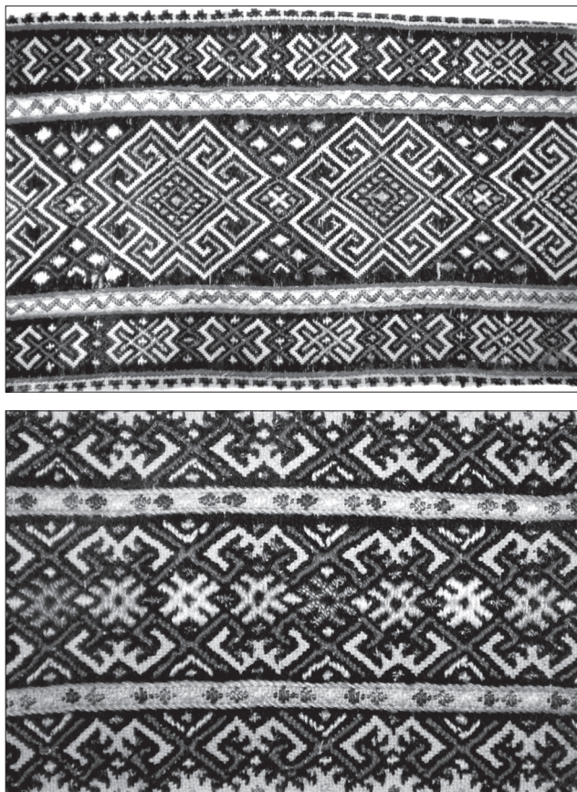
Уставки жіночих сорочок із с. Кобилецька Поляна Рахівського району. Домінуючі мотиви — баранячі різки («вічварки») та ромб зі сторонами, що виступають («восьмиріг»).

у великобичківській вишивці виділяємо такі: ромб, на зовнішніх сторонах якого вишивали короткі перпендикулярні до боків рисочки («вусики», «ріжки»); ромб із короткими рисочками, загнутими в протилежні боки, на зовнішніх сторонах; ромби з усіченими сторонами; ромби з перехресними сторонами; ромб зі сторонами, що виступають («восьмиріг»). Колоритним та архаїчним було поєднання ромба з іншими геометричними мотивами: восьмипелюстковою розетою, прямим та скісним хрестами [5; 6; 7; 52, с. 6].