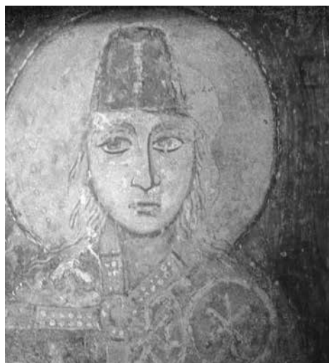
Князь Глеб. Фрагмент

На головах обоих князей – узкие высокие ребристые шапки, несколько суженные к верху. Три видимых ребра чётко прорисованы двойной линией суриком. Особенно хорошо это видно на сохранившемся рисунке шапки Бориса, где даже будто чувствуется материальность – серая добротная ткань. На голове у Глеба шапка такой же формы синего цвета.