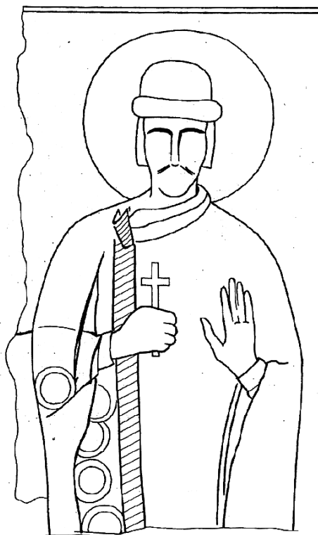
Пятницкая церковь. Князь-мученик Борис. Рисунок-схема

детей Ярослава Мудрого в известном портрете княжеской семи во фресковой росписи Софии Киевской 9 .