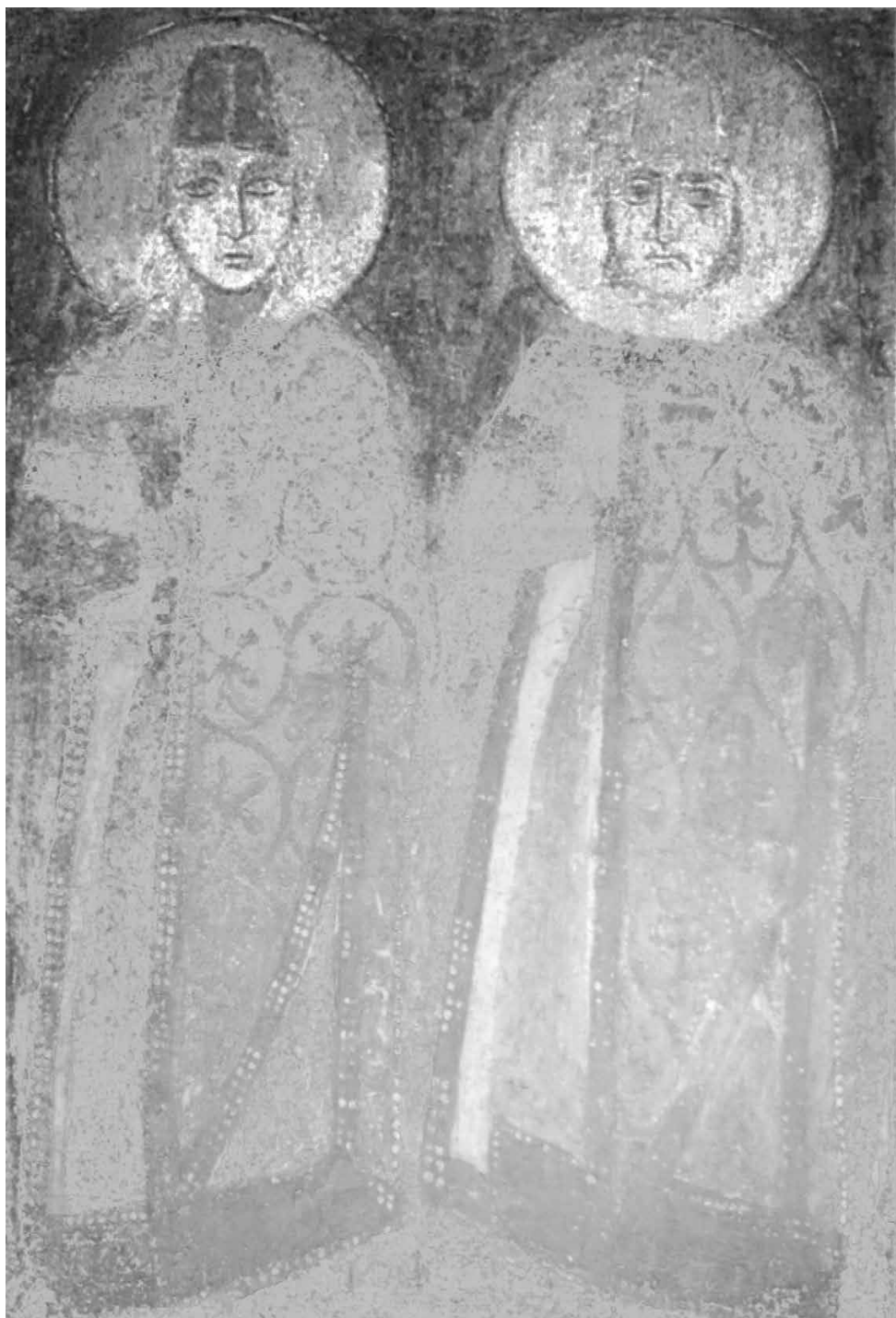
Князья Борис и Глеб