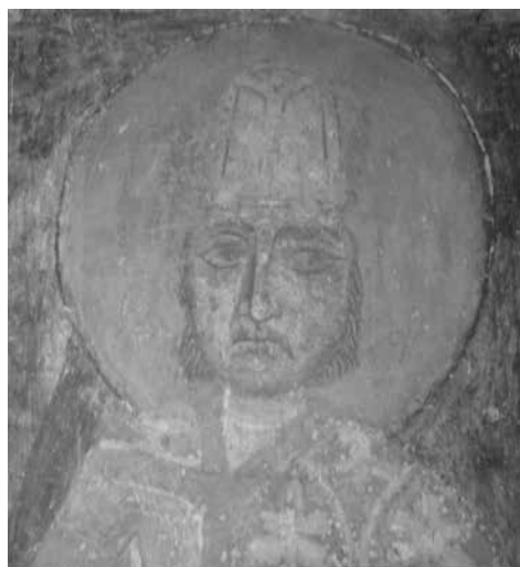
Князь Борис. Фрагмент