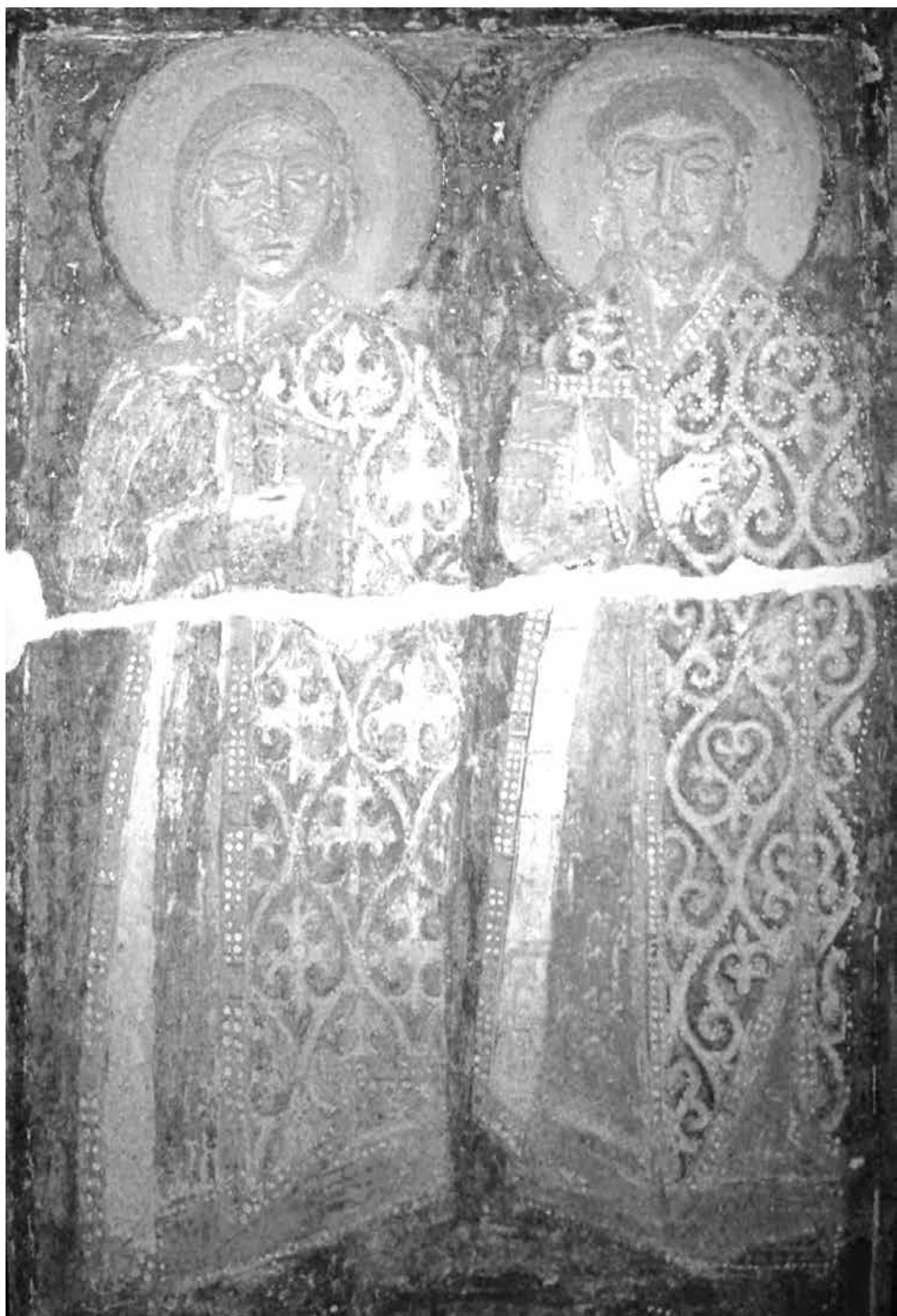
Святые Роман и Вацлав