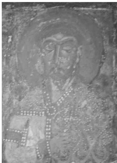
Святой Вацлав. Фрагмент

лозы в две зеркальных линии. Расширяющиеся промежутки в виде чечевицы заполнены красивыми сложными завитками. Кроме жемчужной обниси, по широким тёмно-коричневым бортам, плащ святого Вацлава эффектно украшен небольшими четырёхконечными изумрудными крестами мальтийского типа в обрамлении жёлтых квадратиков. Кафтан святого – приятного бирюзового цвета. У обоих святых плащи скреплены на груди большой круглой застёжкой, богато украшенной “жемчугом”. Плащ святого Романа – красновато-коричневого цвета, украшен также выющимся растительным орнаментом и исполнен светло-жёлтой охрой. Такие же вытянутые чечевичные промежутки между гибкими линиями заполнены рисунком крестов, концы перекладин и верх которых завершены в виде трилистника. По центру пересечения перекладины имеется расширение с изображением объёмного медальона с большой белой точкой внутри. Головы не покрыты. У святого Вацлава она коротко острижена, у святого Романа каштановые волосы на голове разделаны мягкой гибкой линией, они длинные, до шеи, аккуратно зачёсаны и убраны за уши.