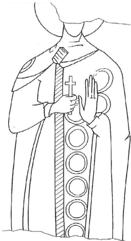
Пятницкая церковь. Князь-мученик Глеб. Рисунок-схема