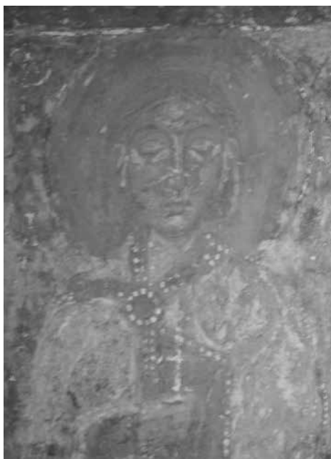
Святой Роман. Фрагмент