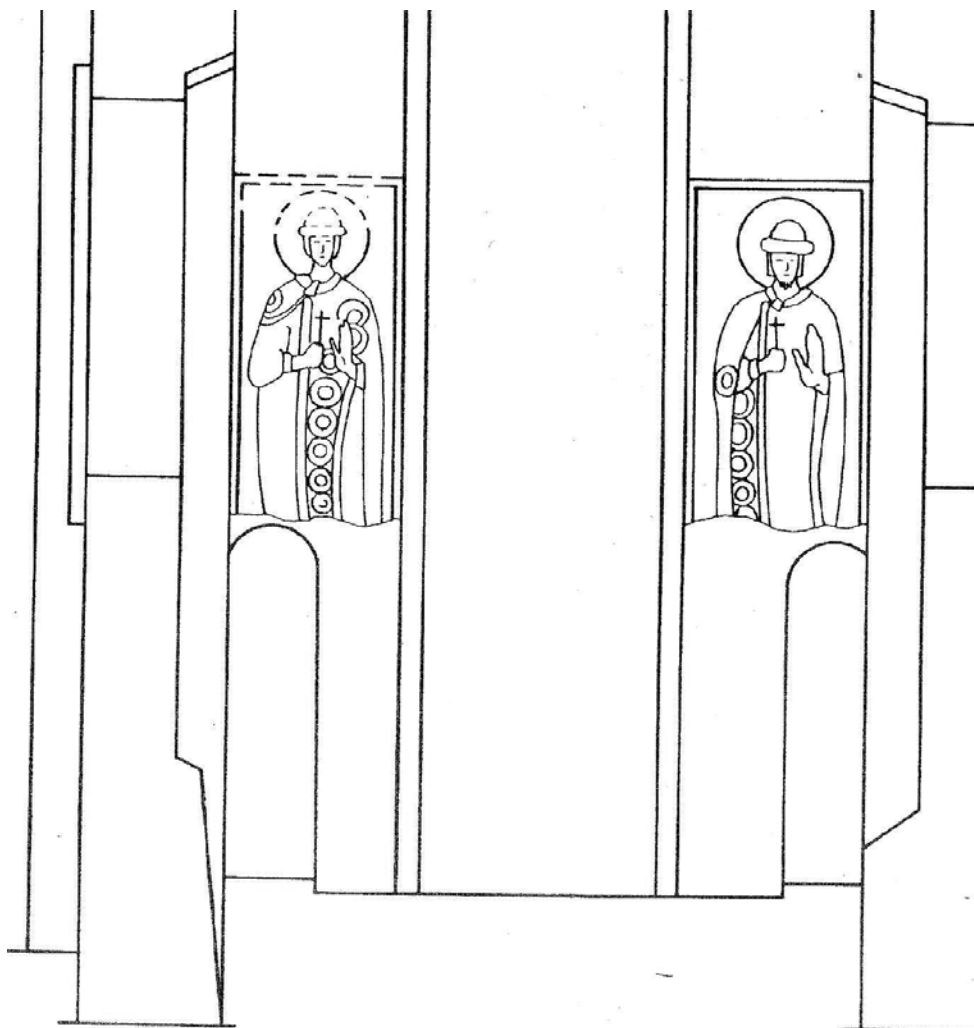
Пятницкая церковь. Роспись восточной стены

также имеет утраты, однако различимы небольшая борода, на голове – светлая меховая шапка с околышем, закруглённая кверху. В длинном плаще с застёжкой на правом плече сохранилась тёмная кайма, проходящая чуть левее середины, линии складок и чёткая красно-коричневая линия, обрисовывающая фигуру. Плащи украшены орнаментом из концентрических окружностей 7 . Орнаментированные подобными большими кругами ткани часто изображались в Менологии императора Василия II (Ватикан, Ватиканская Апостольская библиотека) 8 . Аналогично украшены также одежды