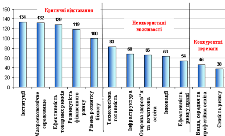
Рис.1. Рейтинги України за 12 складовими Глобального індексу конкурентоспроможності у 2010-2011 рр.

За ЄІТ Україна знаходиться в останній за рівнем інновативності - четвертій - групі «країн, що наздоганяють». Порівняно з іншими країнами ЄС відставання України становить: від «країн-лідерів» – приблизно у 3 рази (Швеція – 0,68), від «країн-послідовників» – 2 рази (Великобританія – 0,48), від країн «помірні інноватори» – 1,6 рази (Норвегія – 0,35). З точки зору інноваційного розвитку, Україна знаходиться на рівні Росії та Болгарії. [4]