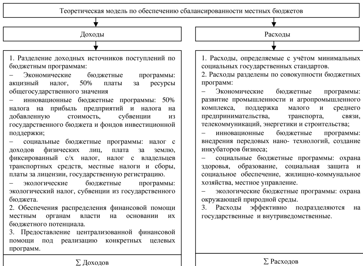
Рис. 3. Теоретическая модель обеспечения сбалансированности местных бюджетов (Составлено автором)

Выводы. Комплексное внедрение предложенных мероприятий по обеспечению оптимизации расходов и увеличения доходов будет способствовать обеспечению сбалансированности местных бюджетов. Создание сбалансированной системы доходов и расходов на местном уровне должно предшествовать комплексные реформы, направленные на внедрения системы финансового баланса территорий, оптимизации межбюджетных отношений и бюджетного регулирования, развитие программно-целевого метода планирования и проведения эффективной, целенаправленной бюджетной политике на местном уровне.