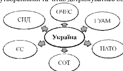
Рис. 1. Напрями інтеграції України

Україна в процесі здійснення своїх інтеграційних дій має різні вектори та направленості національної зовнішньоекономічної політики країни (рис.1). Однак, країна повинна виробити певний ефективний механізм співпраці із світовими інтеграційними утвореннями та чітко дотримуватись обраної стратегії.