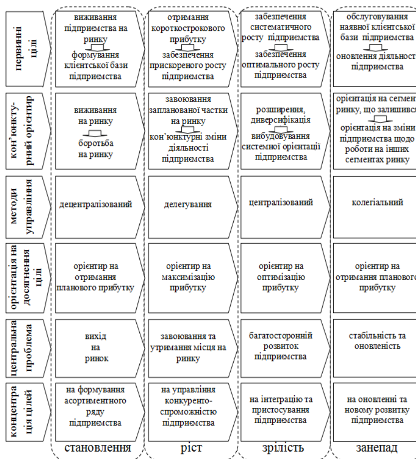
Рис.1. Специфічні особливості стадій життєвого циклу для промислових підприємств