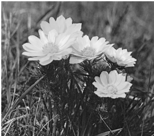
Рис. 3. Adonis vernalis L. в стані цвітіння в Донецькому ботанічному саду НАН України

50 ± 0,1 см висоти. Збільшується кількість осей другого порядку, з'являються осі третього порядку. Листки яскраво-зелені, тричіпирчаторозсічені, з вузьколінійними частками. Квітки поодинокі на верхівці пагонів 7,0 ± 0,1 см діаметром (рис. 3). Кореневище на цьому етапі наростає в товщину 1 ± 0,2 см діаметром, починає галузитись. Насіння досягає через 1,0 – 1,5 місяці після цвітіння.