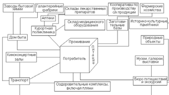
Рис.2. Рекреационный комплекс как пример логистического куста.

Для выявления практического совмещения услуг был проведён социологический опрос населения г. Симферополя в возрасте 18-40 лет. Опрашиваемым предлагалось 8 пар услуг, среди которых они должны были отметить сочетаемые. Респондентов объединили в две возрастные группы: младшая группа (18-25 лет) и старшая группа (26-40 лет). Естественно их разделение и по половому признаку. Результаты опроса приведены в табл. 1.