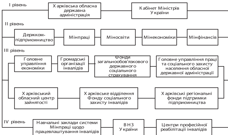
Рис. 2. Ієрархічна структура взаємодії суб'єктів підтримки інвалідів

Висновки. Таким чином, за допомогою методу аналізу ієрархій для забезпечення підвищення якості життя інвалідів шляхом створення сприятливих умов для їх зайнятості та реабілітації до працездатності через зняття обмежень життєдіяльності та забезпечення стабільного розвитку підприємництва інвалідів у Харківському регіоні експерти визначили, яким чином потрібно підтримувати підприємництво інвалідів та забезпечувати їх працевлаштування. Це необхідно реалізувати шляхом цілеспрямованої роботи та співпраці суб'єктів підтримки інвалідів на всіх рівнях ієрархії.