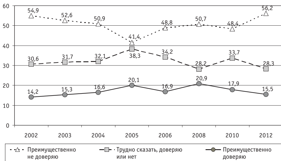
Рис. 4. Динамика распределения ответов на вопрос «Каков уровень Вашего доверия к местным органам власти?», %

ным органам власти в 2005, 2008 и 2012 годах (см. Приложение Б, табл. Б.10-Б.12). Для удобства коэффициенты соответствующих уравнений регрессии ( \beta , R^2 , скорректированный R^2 ) сведены в единую таблицу (табл. 4).