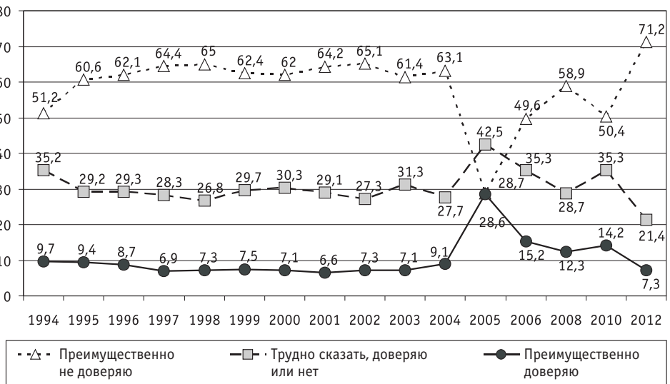
Рис. 1. Динамика распределения ответов на вопрос «Каков уровень Вашего доверия к Верховной Раде?», %

В частности, полномочиями парламента Украины в социально-экономической сфере являются: определение основ внутренней и внешней политики и принятие общегосударственных программ экономического развития; принятие решений о предоставлении Украиной займов и экономической помощи иностранным государствам и международным организациям, а также о получении Украиной от иностранных государств, банков и международных финансовых организаций займов; принятие Государственного бюджета Украины, внесение изменений в него и контроль за его выполнением; утверждение перечня объектов права государственной собственности, которые не подлежат приватизации; определение правовых основ изъятия объектов права частной собственности (действующая Конституция Украины, Ст. 85). В зависимости от успешности или неуспешности реализации указанных полномочий Верховная Рада Украины может пользоваться доверием или недоверием в обществе. В частности, динамике доверия к парламенту присуще особое непостоянство (см. рис. 1).