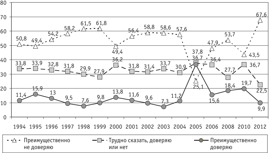
Рис. 2. Динамика распределения ответов на вопрос “Каков уровень Вашего доверия к правительству?”, %

ности или неуспешности реализации указанных полномочий правительство может пользоваться или не пользоваться доверием в обществе. Динамике этого доверия свойственно непостоянство, аналогичное рассмотренному выше непостоянству доверия к парламенту (см. рис. 2).