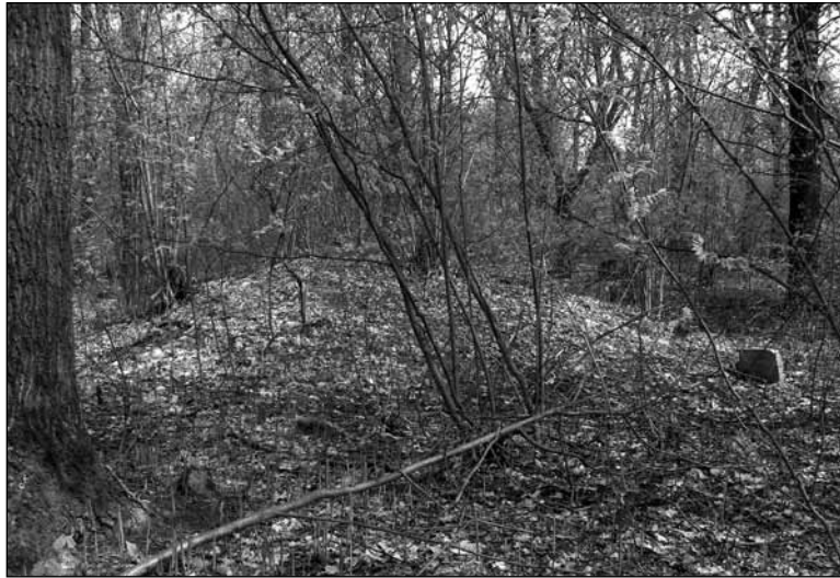
Рис. 1. с. Озеряни, курган на кладовищі