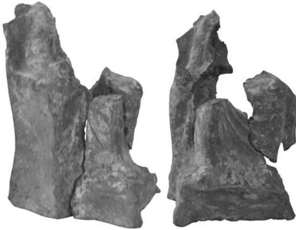
Рис. 5. Фрагментована фігурка Матері богів: О-56/459

особливостей і схеми зображення з попередніми зразками не викликає сумніву, що воно містилося на цій теракоті. Висота вцілілої частини 13,6 см. Вона складається з трьох фрагментів, незначної товщини і з крихкою поверхнею. Глина темно-сірого кольору. Збереглися рясні сліди білої обмазки. На лицьовій поверхні підніжжя і підлокіття трону — залишки червоної фарби. Ширина підніжжя трону, як і у попередніх статуетках, 7,2 см. Ширина бокової частини дещо менша. Боковини трону загорнені на тильну сторону і з'єднані там від рівня висоти підлокіття. В описі знахідок згадується лише про два фрагменти теракоти. Знайдені вони на ділянці Е6, у підвальному приміщенні на кв. 405 (Славин 1956). Збереглися нижня і права частини статуетки, на яких видно зображення правих плеча і передпліччя Матері богів, обох ніг, вкритих драпіровками, на підставці; бокової частини трону зі спинкою, на якій по кутах були характерні виступи, і підлокіття. Кисть руки, в якій, вочевидь, була фіала, значно випиналася з рельєфу. Від лівої частини фігури вціліло коліно, біля якого звисають складки гіматія, і ріг підлокіття трону.