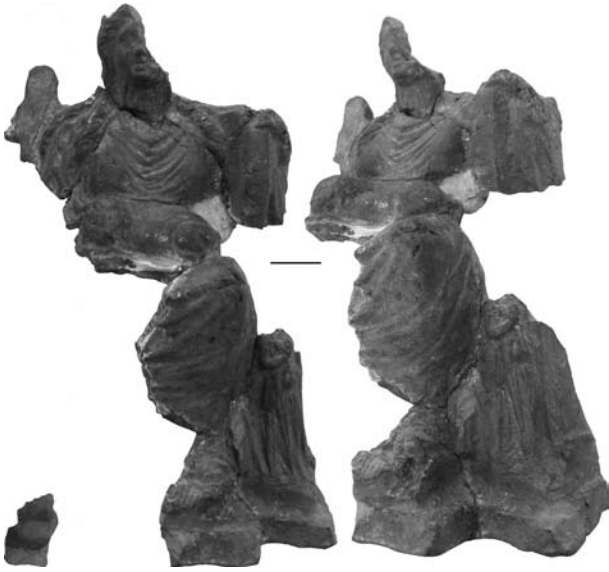
Рис. 2. Фрагментоване зображення Матері богів: О-59/1922

стоять на спині лежачого лева (Кобылина 1978, с. 11). Правою ногою на голову левеняти спирається Матір богів на теракоті з Нижнього Подністров'я, датованій кін. VI — поч. V ст. до н. е. (Фидельский, Сеника 2005, с. 281, рис. 1, 1), ліва нога її накрита гіматієм. Відрізняється схематизмом теракота, знайдена на Мітрідаті, із зображенням богині, що обидві ноги поставила на лева (Кобылина 1974, с. 51, табл. 61, 5). Той самий сюжет представлено на теракоті II ст. до н. е. з Мірмекія (САИ, II 1970, табл. 42; Денисова 1981, с. 53, табл. XV, а). Однак стилістично вони мають суттєві відмінності: боспорський зразок відрізняється більш схематичним, навіяним впливом малоазійської мармурової скульптури, трактуванням лева. Вкрай сумарно зображено богиню з левом під ногами на боспорських статуетках I—II ст. н. е., де лев обернений вправо (Античное... 1999, с. 34, № 50; Ханутина 2011, с. 223, рис. 1, 1, 2). Наш фрагмент представляє м'якше і детальніше трактування зображень, що наближає його до більш ранніх теракот елліністичного періоду (Вурт 1963, р. 283). Сам сюжет попирання ногами лева В.І. Денисова виводить із малоазійського релігійного ґрунту (1981, с. 52, 53).