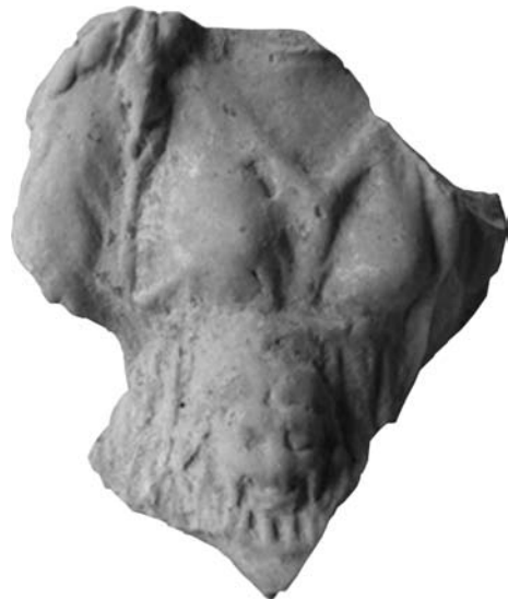
Рис. 8. Фрагмент зображення Матері богів з левеням: О-67/478

На підставі особливостей зображення деталей: гриви левеняти, рук богині тощо можна зробити висновок, що датувати цей тип слід пізнішим часом, ніж проаналізований вище. Зокрема, пальці показані горизонтальними прокресленими лініями, грива — вдавненнями заокругленим на кінці