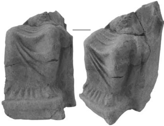
Рис. 4. Нижня частина фігурки Матері богів з левеням: О-66/800

лова, виступ на троні. За аналогічним способом передачі розмитих драпіровок гіматія, що спадає по плечі, хітона, що утворює трикутні складки під шиєю, масивної шиї, бюсту, за розташуванням пасом волосся можна робити висновок, що зображення аналогічне попередній теракоті О-59/1927. Фрагмент надто незначний, щоб впевнено робити висновок про його виготовлення в тій же формі. До того ж, вигин трону від вертикального виступу до шиї богині дещо вузчий, ніж у попередньої статуетки. Однак, усі інші деталі дають підстави вважати його належним до статуетки того ж типу. Ця фрагментована фігурка побувала у пожежі, про що свідчить обвуглена глина на зламах у верхній частині фрагмента.