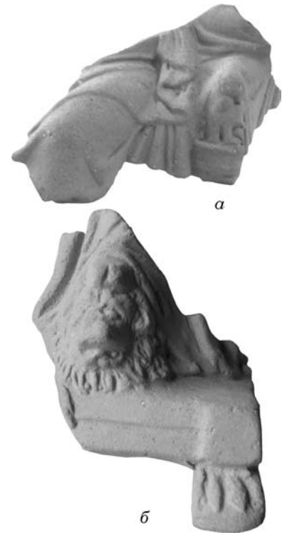
Рис. 1. Фрагменти зображення Матері богів: а — б/№; б — О-59/1930

ся знайти серед фотографій знахідок 1959 р. під № 1984, хоча в інвентарних списках цей номер відповідає іншій знахідці (Альбом 1959, л. 16; Инвентарная 1959). Вціліло зображення правого кута профільованого підніжжя трону, де ступня богині стоїть на піднятій голові лева. Висота фрагмента 6,1 см, ширина 5,6 см. Носок ноги, як і на багатьох зображеннях Матері богів на троні, розділений надвое, можливо щоб показати обрис сандалії. Чітко виділені драпіровки плавно спадають над ступнею і головою левеняти, що спокійно лежить під нею. Тварина обернена головою вліво, деталі її зображення були чітко пророблені вже у формі: очі, масивні надбрівні дуги, морда, розкішна грива, внизу оформлена подібно до ов на архітектурних деталях. Ніжка трону зроблена у вигляді могутньої лев'ячої лапи. Глина яскраво-оранжева, з дрібними домішками білого і чорного кольору.