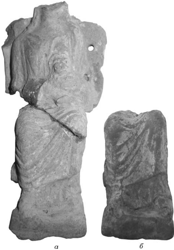
Рис. 7. Фрагменти зображень Матері богів: а — О-54/2386; б — О-63/1031