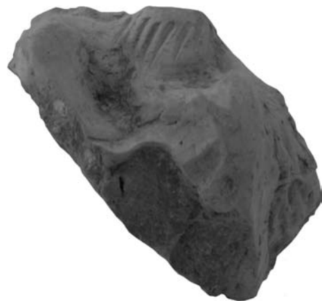
Рис. 9. Фрагмент статуєтки з зображенням левеняти: О-49/126