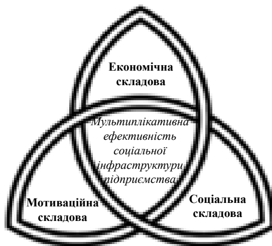
Рис. 1. Трикутник ефективності управління соціальною інфраструктурою промислового підприємства

Економічна складова показує доцільність утримання соціальної інфраструктури, тобто містить у собі показники прибутковості або хоча б самоокупності, що дає керівництву інформацію про те, чи є конкретний об'єкт соціальної сфери тим, що самофінансується. Мотиваційна складова проявляється в активній підтримці персоналом підприємства наявності певних об'єктів соціальної інфраструктури, не завжди при цьому прибуткових для суб'єкта господарювання. Як правило, менеджмент підприємства має право на