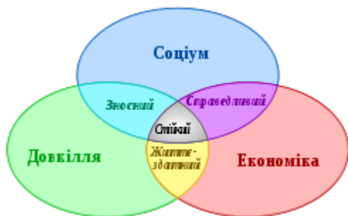
Рис.1. Триєдина концепція стійкого розвитку

З стійким розвитком пов'язане прогресивне перетворення економіки і суспільства. Розвиток, стійкий по матеріальних параметрах, теоретично може мати місце навіть у жорстких соціальних і політичних рамках. Але фактично ця стійкість може бути забезпечена лише у випадку, коли при розробці політики розвитку приділяється увага таким питанням, як зміни в доступі до ресурсів і в розподілі витрат та прибутків між різними верствами населення, враховуючи принципи справедливості в межах кожного покоління.