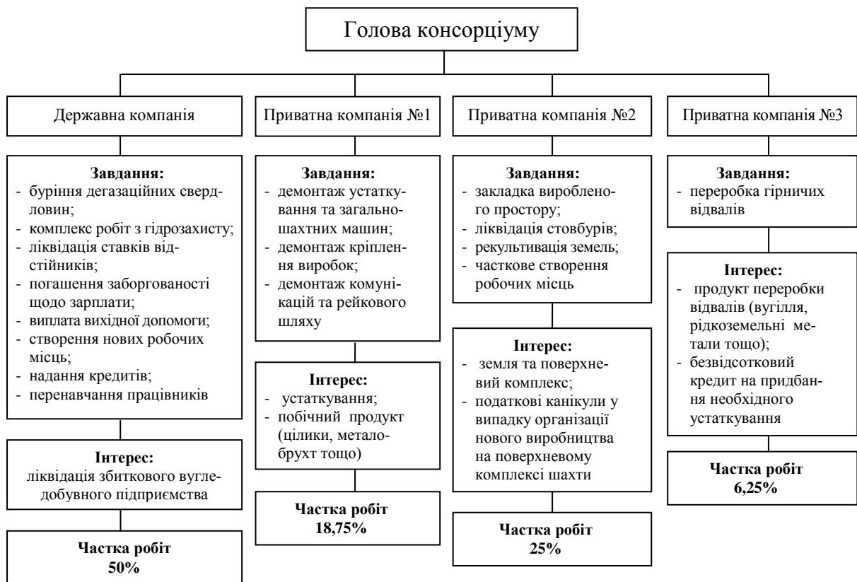
Рис. 2. Умовна модель державно-приватного консорціуму (розроблено автором)

що податкові канікули можуть бути надані лише за умови працевлаштування не менш ніж 10% вивільнених з вугледобувного підприємства шахтарів. Інтерес приватної фірми №3 полягає в отриманні продукту переробки гірничих відвалів. Вміст вугілля у гірничих відвалах в Україні складає 5-30% [17], що разом із можливістю виїмки рідкоземельних металів робить процес переробки потенційно вигідним. Спонукальним чинником до виконання даних робіт може стати державний безвідсотковий кредит, наданий компанії з метою придбання відповідного устаткування.