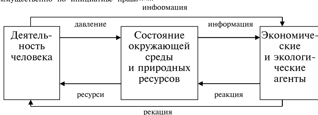
Рис. 2. Система индикаторов устойчивого развития типа «давление-состояние-реакция»

ства на национальном и международном уровнях, когда необходимо учесть все его аспекты, а прямые связи между различными «давлениями» и «состояниями» невозможно выявить [17, с.12]. Система включает в себя четыре аспекта устойчивого развития: социальный, экономический, экологический и институциональный. Социальный аспект отображается в следующих темах: справедливость, здоровье, образование, жилье, безопасность; экологический – атмосфера, земля, океаны, моря и побережья, пресная вода и биологическое разнообразие; экономический – экономическая структура, модели потребления и производства; институциональный – институциональное обеспечение, институциональный потенциал.