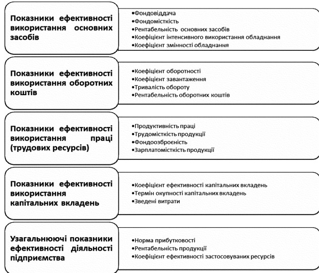
Рис. 1. Групи показників діяльності підприємства

Групи показників, що виділяють у системі показників ефективності господарської діяльності суб'єкта господарювання наведено на рис. 1.