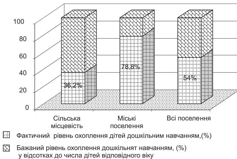
Рис.2. Рівень охоплення дітей дошкільною освітою в Україні, 2006 рік [5;11]

На жаль, доступна дошкільна освіта в Україні давно перестала бути реальністю: черги для вступу дітей у відповідні заклади утруднюють доступ до освіти та водночас провокують розвиток корупції. Перебування у дитячому закладі нерідко обумовлюється “добровільними благодійними внесками”, різноманітною допомогою батьків, оплатою ними харчування, підручників тощо.