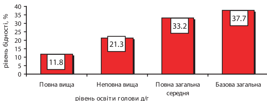
Рис. 1. Рівень бідності залежно від рівня освіти голови домогосподарства, 2006 р.

доходами, серед осіб з повною вищою освітою у 3 рази більше, ніж серед представників з повною середньою освітою (рис. 2).