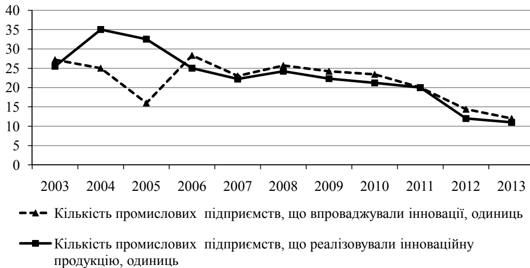
Рис. 1. Динаміка кількості промислових підприємств Закарпаття, що впроваджували інновації та реалізовували інноваційну продукцію, у 2003-2013 рр. [6; 7; 11; 12]