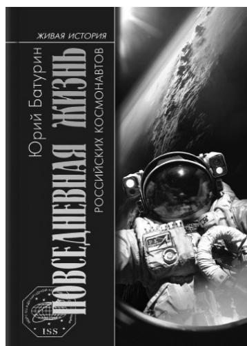
Монографии Ю.М. Батурина по космонавтике