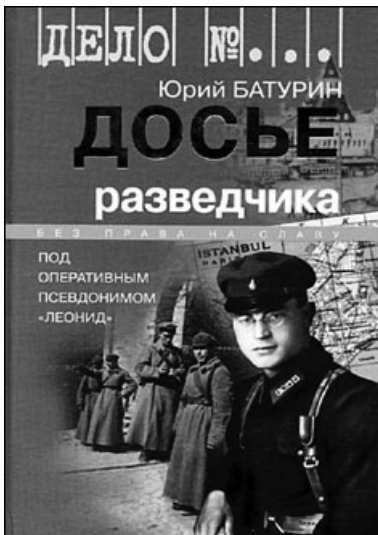
Книга Ю.М. Батурина об отце

ны также воспоминания участников (как космонавтов/астронавтов, так и конструкторов, учёных, наземного персонала), сведения об отрядах космонавтов СССР/России, США, Китая и др., более 3000 фотографий и 60 рисунков. Во второй книге, опубликованной в серии «Живая история: повседневная жизнь человечества» приводится множество фактов о космическом транспорте и космических путешествиях, реализованных и неосуществленных проектах, книга поднимает острые вопросы, от которых зависит дальнейшая судьба отечественной космонавтики.