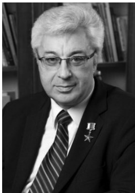
Юрий Михайлович Батурин

В связи с юбилейной датой освещены жизнь и деятельность члена-корреспондента РАН Ю.М. Батурина, директора Института истории науки и техники им. С.И. Вавилова РАН.