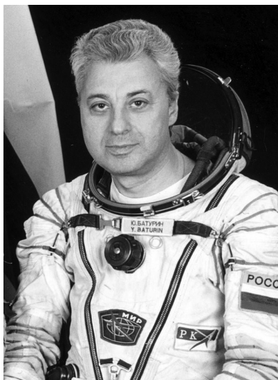
Ю.М. Батурин — космонавт

качестве кандидата в космонавты. С 10 октября 1997 г. по 17 февраля 1998 г. прошёл ускоренную общекосмическую подготовку в Центре и ему была присвоена квалификация космонавта-исследователя.