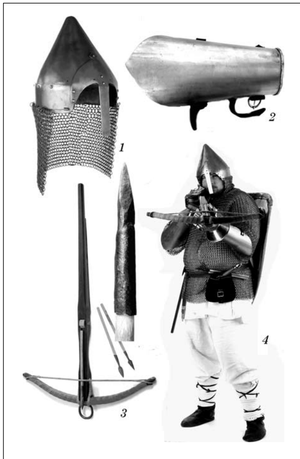
Рис. 5. Стрелець-арбалетник з почту пана (реконструкція): 1 — шолом з бармицею; 2 — наруч; 3 — арбалет та болти, вістря болта; 4 — арбалетник у обладунках, готовий до пострілу

Вірогідно, саме подібним чином озброєні вершники і були поставлені князем Олександром-Вітовтом на чолі «клинів», які він уряджав шостого липня 1410 року, незадовго до Грюнвальдської битви.