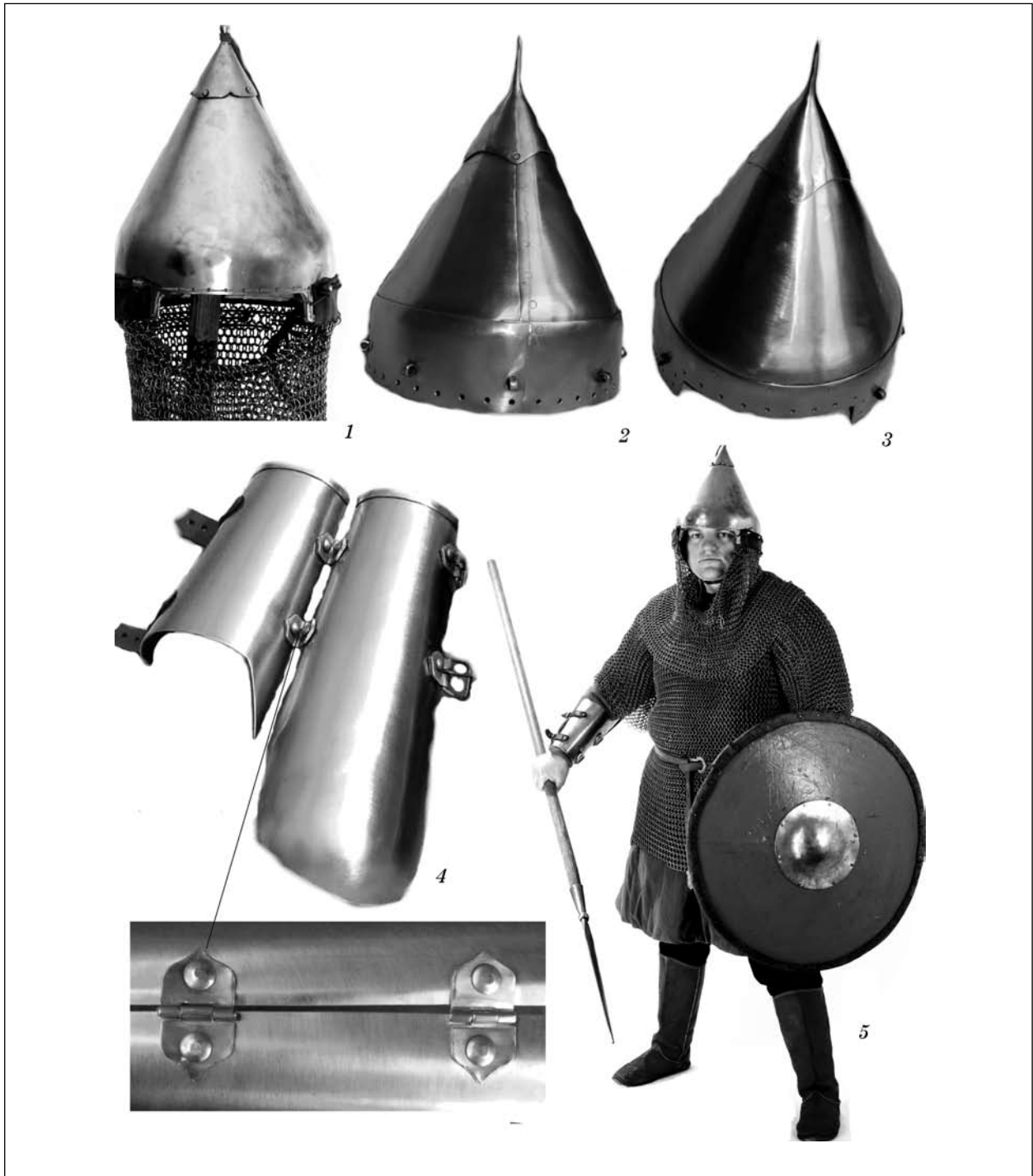
Рис. 4. Руський боярин з Київщини(реконструкція): 1—3 — відтворення шолома; 4 — наруч; 5 — боярин у захисних обладунках, з щитом та списом

військової еліти Київщини. Зразком для виготовлення даного комплекту слугував латний захист кінцівок, відомий за іконографічним та археологічним матеріалом. Технологія виготовлення — кування. Кріплення наплічників — за допомогою ременів з пряжками, а також тонких шкіряних ремінців, пришитих до одягу під кольчугою. Захист ніг у верхній частині закріплено аналогічним чином до одягу під кольчугою, решта — ременями з пряжками.