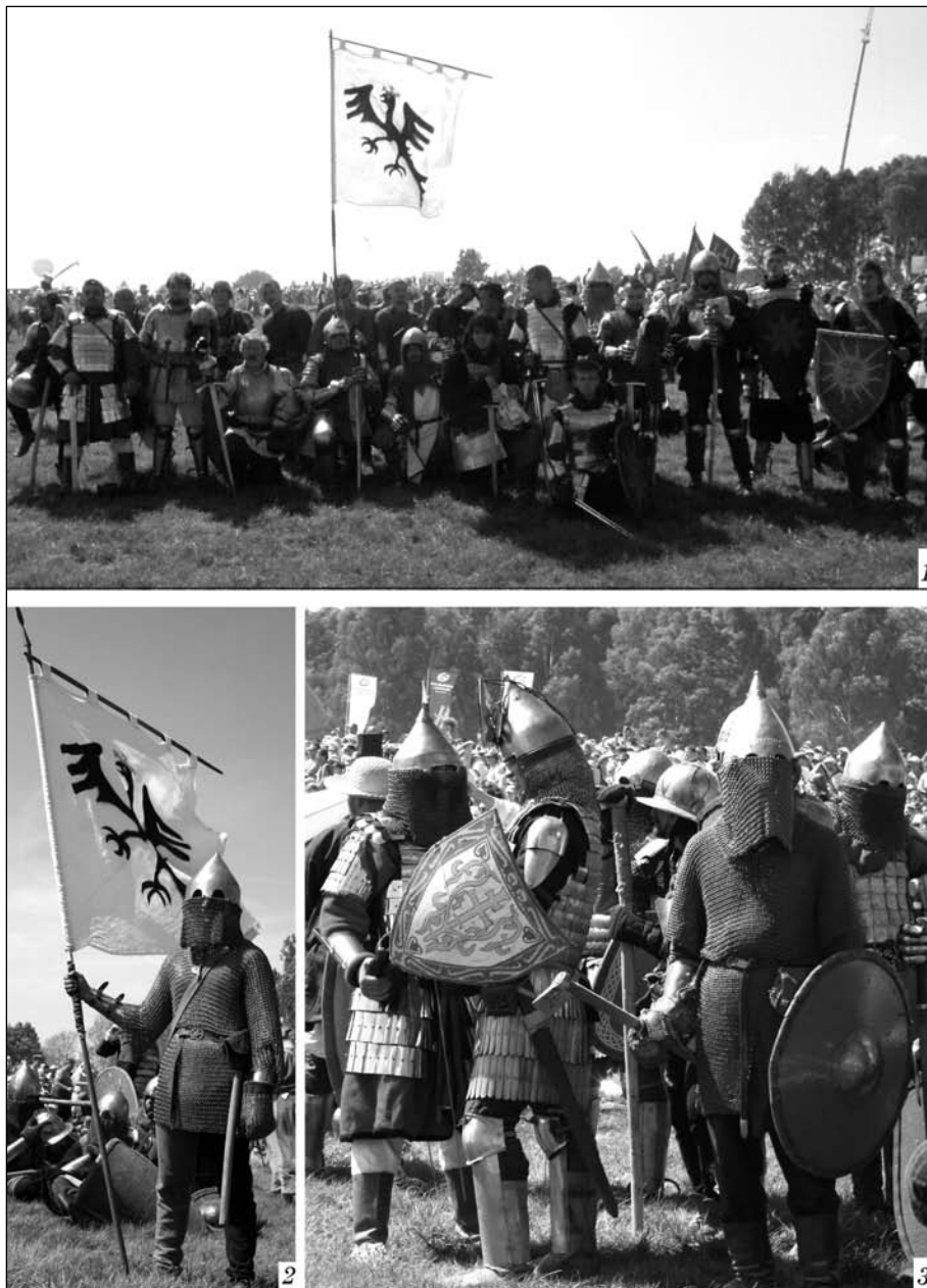
Рис. 1. Інценізація Грюнвальдської битви 2010 року, Польща: 1 — «Галицька хоругва», представлена ре конструкторами з різних міст України під знаменом із зображенням галки; 2 — знаменоносець «Галицької хоругви» у «руському» озброєнні; 3 — учасники «Галицької хоругви»

Як виглядали ці багатотисячні армії? Пересічна людина може судити про це переважно із фільмів, картин, ілюстрацій до художніх творів. Однак, на жаль, навіть найкращі з подібних творів відтворюють, як правило, картину далеку від реальної — і це стосується не лише костюмів чи зброї, але й поведінки, мови персонажів, не кажучи про відтворення батальних сцен.