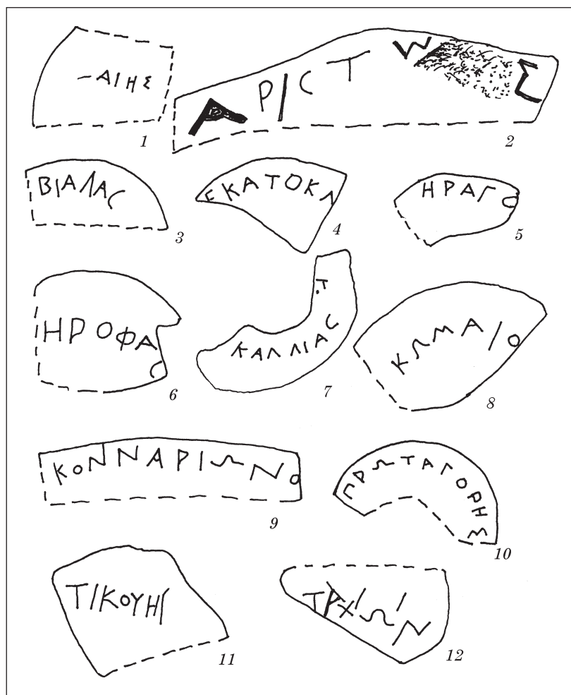
Табл. 1. Граффити с полными личными именами

фические особенности надписи в общем соответствуют датировке сосуда: укороченная правая гаста ни, ро с угловатым завитком почти не имеет внизу вертикали, широкие омега , растянутая сигма . Следует также отметить особую аккуратность автора и равномерность расположения большинства букв, чему явно способствовало точное размещение надписи между двумя полосками в цвете глины и пурпура.