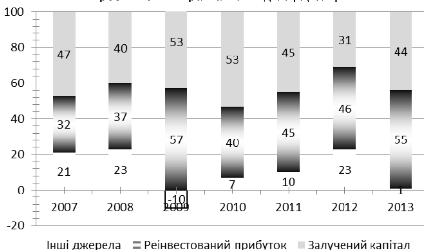
Рис. 3. Структура джерел капіталовкладень, здійснених ТНК, в країнах, що розвиваються, % [7, с.2]