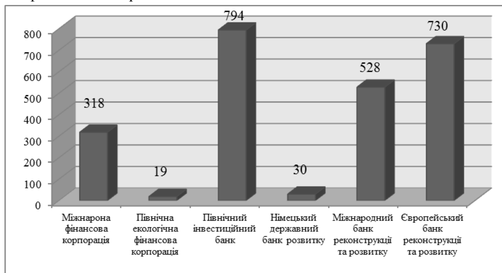
Рис. 2. Іноземні інвестиції в розвиток «зеленого» бізнесу в Україні у розрізі інвесторів, млн. євро [4]

сфери «зеленого» бізнесу перебувають на етапі заснування через брак фінансових ресурсів, відсутність нормативно-правового підґрунтя та неефективність державної екологічної політики.