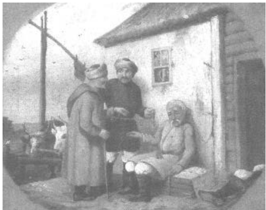
В. Штернберг. Чумаки біля корчми. Олія, 1840 р.

Визначний учений і дослідник запорізької старовини Дмитро Яворницький описав каптани, які знайшов у нащадка запорізького козака Мокія Лося. Ці каптани були пошиті з червоного сукна (бурякового кольору), на клітчастій підкладці перського виробу. Були вони широкі в плечах і вузькі в перехватах (талії); застібалися на грудях за допомогою шовкових петель і гудзиків.