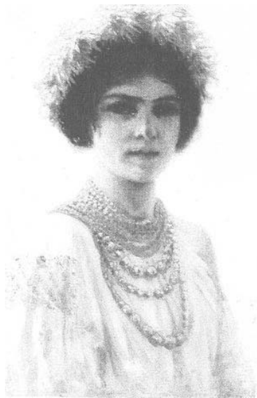
Г. М'ясосдов. Дівчина-українка. Олія, 1904 р.

У наукових, літературних, архівних джерелах XIX ст. знаходимо відомості