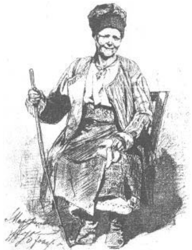
П. Мартинович. О. Буштримиха. Олівець 1875 р.

Ой десь того чумака під Кримом убито, Червоною китайкою головоньку вкрито [77].