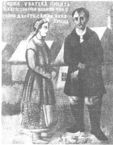
Українська народна картина «Гапка у батька просить». Олія. 1-а чверть XIX ст.