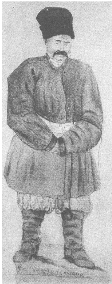
Т. Шевченко. Се мій батько. Олівець, туш, кін. 1830-х рр.

Такий кобеняк обгортав поставу з голови до п'ят і захищав чумака в дорозі від дощу, буревію, пилюки тощо. До того ж під кобеняком не так зношувався й витирався спідній одяг.