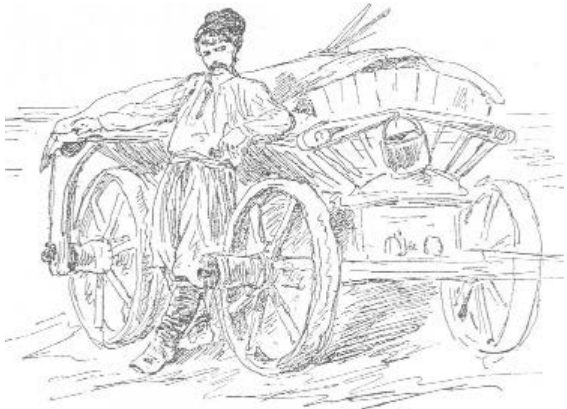
К. Трутовський. Чумак. Олівець, 1889 р.

Зазначимо, що чумаки тільки в дорозі порушували українську народну традицію охайності: регулярно змінювати білизну [6]. До заселення Півдня як тільки чумак перебирався за Дніпро, біля Микитиноного Перевозу, одразу ж змашував свою буденну сорочку і шаро-