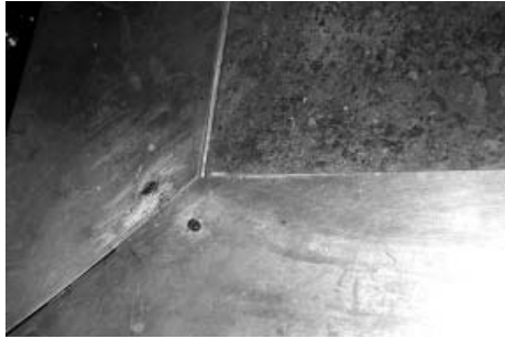
Мал. 2. «Трапеза» престолу Андріївської церкви (фрагмент)

тіло й кров Господню) [7]. Тому сюжети, пов'язані з таїнством Євхаристії (або її старозаповітні «прототипи»), є доволі поширеним явищем: рельєфні зображення «Тайної Вечері» на окладі престолу 1911 р. з церкви Різдва Богородиці на Подолі у Києві [8] та на західному боці окладу престолу 1896 р. у Володимирському соборі у Києві [9]; рельєфне зображення «Жертва Авраама» [10] на окладі престолу (знищений у 1942 р.) з Успенського собору Києво-Печерської лаври [11].