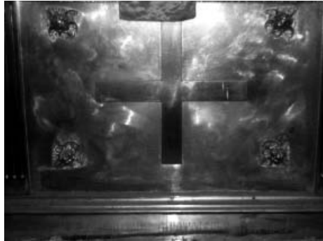
Мал. 5. Накладка «Рівнорамний хрест» (фрагмент західної дошки металевго облачення престолу Андріївської церкви).

й Адмілартейства, «тогда называли мрамором» [26]. Петербурзький археолог Віктор Абрамович Коренцвіт наголошує, що «и сейчас кое где в Петербурге, например в нижней галерее Гостинного двора, можно встретить полированные плиты путиловского известняка, редкой расцветки: серый фон испещрен мазками красного, желтого и зеленого цветов. Игра красок – свидетельство примеси окиси железа – особенно заметна на мокрых плитах» [27].