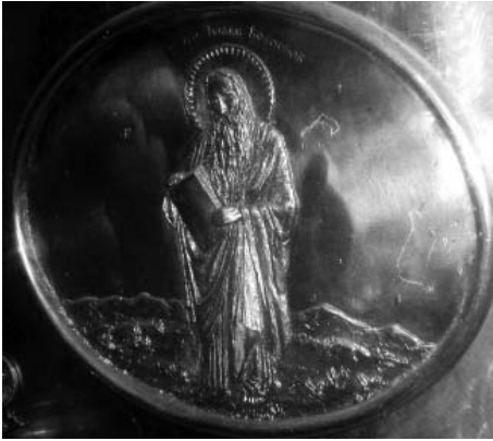
Мал. 8. Накладка «Апостол Іоанн Богослов» (фрагмент східної дошки металеве облачення престолу Андріївської церкви).

з міді було надзвичайно розвинене в Російській імперії наприкінці XIX – на початку XX ст.: «По данным металлических промыслов, к концу XIX – началу XX столетий меднолитейное дело получило особенно большой размах. К примеру, в Московской губернии в конце XIX в. в одной только Новинской волости существовало 45 меднолатунных и медноотливных заведений, в которых, вполне вероятно, занимались и литьем культовых предметов» [45]. Ймовірно, вибір саме цього металу для оздоблення престолу Андріївської церкви був обумовлений насамперед його відносно