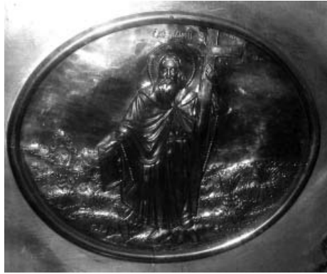
Мал. 9. Накладка «Апостол Андрій Первозваний» (фрагмент південної дошки металевго облачення престолу Андріївської церкви).

Постає логічне запитання: наскільки сучасники ініціаторів оновлення престолу Андріївської церкви у 1899 р. вірили в те, що цей храм розташований на «сакральному місці» встановлення хреста Апостолом? Це запитання задавав собі видатний вчений Михайло Максимович (1804–1873): «На каком же именно месте старокиевской горы поставлен был крест св. Андреем?» Учений зі справедливим скепсисом поставився до можливості його точного визначення: «Об этом, кажется мне, не было уже предания у Киевлян одиннадцатого века»