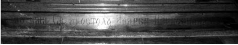
Мал. 6. Напис на п'єдесталі престолу Андріївської церкви (фрагмент).

Андреевской церкви» (1899 р.) [30], яка проливає світло на історію виготовлення облачення престолу: дозволяє встановити ініціаторів його створення, матеріали і майстра, що виготовив цей яскравий зразок художньої обробки металу кінця XIX ст.