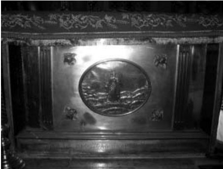
Мал. 1. Престол Андріївської церкви

Метою даної розвідки є дослідження історії престолу Андріївської церкви, що передбачає вирішення наступних завдань: установлення часу його виготовлення; визначення символіки матеріалів, з яких були створені престол і його оздоба; аналіз зображень на облаченні престолу; ідентифікація майстрів і замовників, завдяки зусиллям яких «сакральний центр» Андріївської церкви нині є справжньою пам'яткою мистецтва.