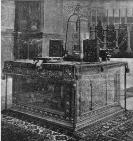
Мал. 10. Срібний оклад 1896 р. престолу Володимирського собору у Києві (Кінець XIX ст.).

ймається на Андріївський пагорб, і підтвердив це власними враженнями: «Это мнение стародавних Киевлян охотно признаешь, взойдя на ту прекрасную высоту Надднепрянскую» [57].