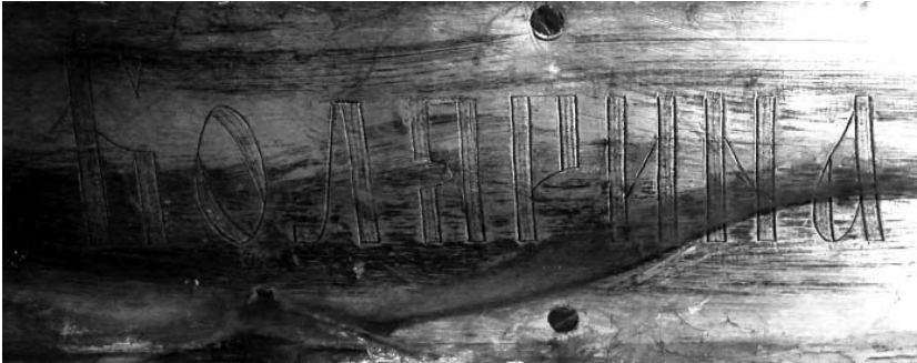
Мал. 14. Напис на п'єдесталі престолу Андріївської церкви (фрагмент).