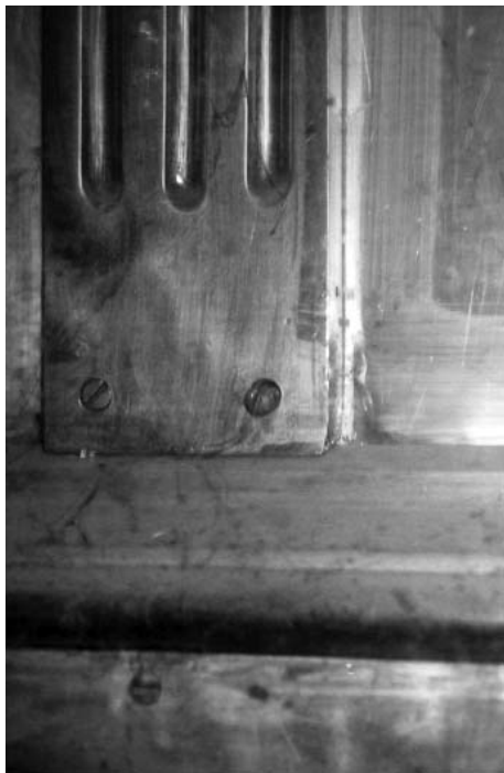
Мал. 4. Накладка «Пілястра» на металевому облаченні престолу Андріївської церкви (фрагмент).

Звертає на себе увагу той факт, що «Божественним проведінням» була надана «трапеза» саме з каменю – матеріалу необхідного для створення престолу «великої» церкви [21]. Ймовірно, матеріал престолу 1753 р. («мрамор») також