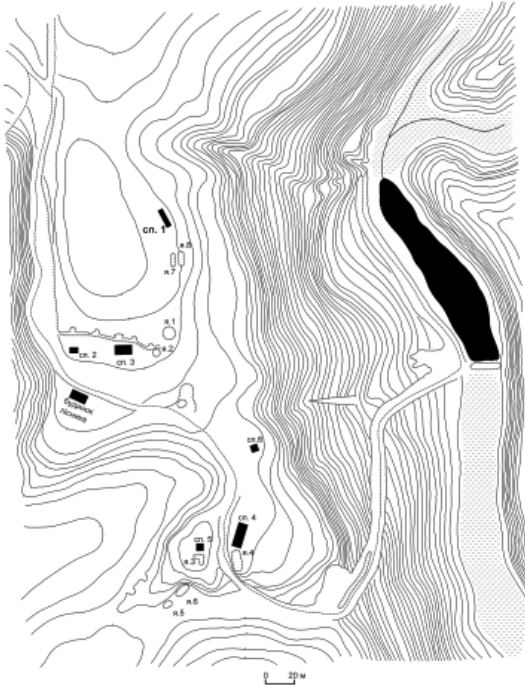
Рис. 1. Владичний хутір Софроніївського монастиря. План. О.М. Кравченко, О.В. Коротя. 2010 р.

тини – 100×80 м. Висота над рівнем заплави становить 42 м. Майданчик мису має прямокутну форму, південна та західна частини мають сліди штучного підрізання схилу на висоту від 1,5 до 2,3 м. Поверхня рівна, у центрі знаходяться залишки фруктового саду. Дослідження не проводилися у західній частині мису, де знаходиться невелике кладовище середини ХХ ст.