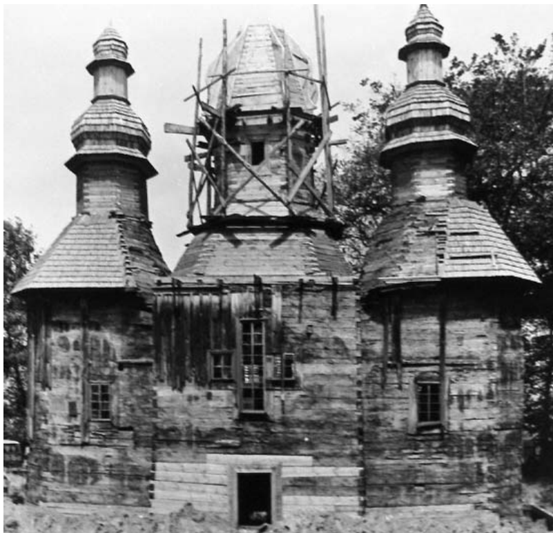
Рис. 5. Покровська церква (1740 роки) у м. Фастів Київської обл. до та після реставрації. Фото 1975 та 1977 р.