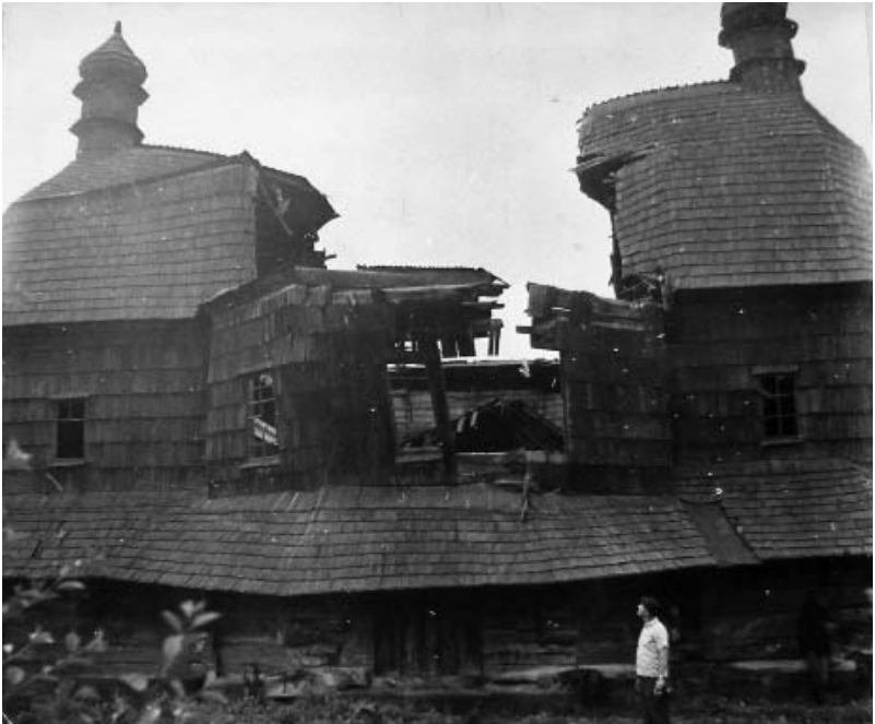
Рис. 2. Воздвиженська церква у м. Чортків Тернопільської області. Фото напередодні реставрації 1960 та 1967 р.

Питань суто реставраційного характеру подекуди торкаються не тільки реставратори, але й дослідники дерев'яної архітектури. Так, зокрема, П.І. Макушенко [11] наголошує, що підтримка нормального експлуатаційного стану об'єкту (шляхом здійснення регулярних ремонтних робіт) є головною умовою його збереження. Автор указує на доцільність залучення ряду прийомів, що забезпечуватимуть вентиляцію та запобігатимуть гниттю деревини. Безпосередньо стикаючись із проблемами збереження об'єктів народної архітектури «на натурі», П.І. Макушенко [12] наголошує на найбільш актуальних: залишення цінних пам'яток без необхідного піклування; руйнування типових житлових і господарських будівель; реалізація проектів реставрації теслями низької кваліфікації без нагляду фахівця (наприклад, церква в с. Олександрівка на Закарпатті (середина XVIII ст.), 1965–1966 роки).