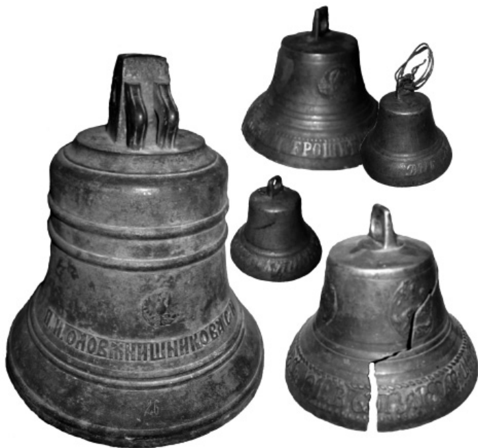
Мал. 6. Дзвони XIX ст. (із зібрання Новомосковського державного краєзнавчого музею). Фото автора, 2006 р.

тійських традиціях, але образотворчі елементи, виконані вишивкою шовковою ниткою, мають живу народну виразність і змістовність. У другій половині XVIII ст. посилюється вплив барокових тенденцій, в образотворчому мистецтві з'являється типаж, неначе вихоплений із народного життя, позначений рисами індивідуальності, у якому дивним чином співіснують риси реалізму та декоративності.