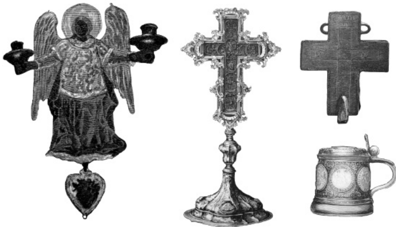
Мал. 2. Декоративні вироби для оздоблення запорозьких церков (зі збірки Нікопольської Покровської церкви та церкви у с. Гологрушівка). За матеріалами Г. Грачова.

тецтво запорозького часу, тому ми вважаємо за потрібне ввести до наукового обігу раніше невідомі шедеври релігійного характеру.