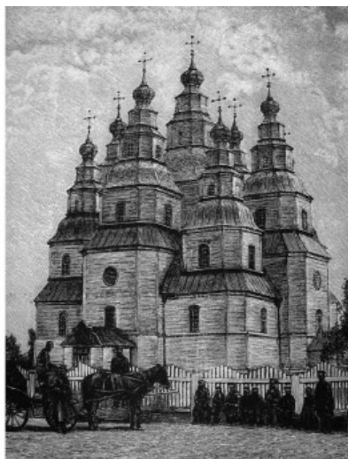
Мал.1. Найвідоміші храмові споруди Нижнього Придніпров'я XVIII ст.: церква в ім'я Архистратига Михаїла у Старому Кодакі (не збереглася) та Троїцький собор у Самарчику (сучасне м. Новомосковськ) до перебудови. Світлина XIX ст.

частинами якої є мистецтво й архітектура. Саме у козацьку добу XVI–XVIII ст. ці традиції набувають певного сенсу. Зріст національно свідомого елементу сприяв розвитку культурного і духовного життя на українських землях. Церковне будівництво набуло певного масштабу, оскільки козацтво виступило у ролі оборонця національної церкви. Багато церков у цей період будувалася на Запорозжі у містечках, селах і козацьких зимівниках [7].