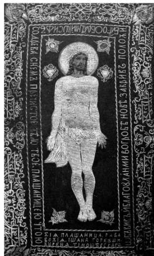
Мал. 5. Живопис і декоративне шитво запорозького часу (із зібрання Нікопольського державного краєзнавчого музею). За матеріалами Г. Грачова.

Добре відомі речі церковного вжитку із Січового Покровського храму, собору Самарського монастиря – це і плащаниця на якій зображено тіло Христа, і різнокольорові фелони та воздухи з символічними зображеннями. Пропорції, трактування, контури, символи та семантика вказаних пам'яток були виконані у визан-