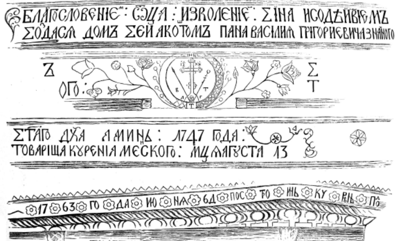
Мал. 3. Декоративне різьблення на сволоках запорозьких куренів. З малюнку І. Репіна.

Збереглися поодинокі зображення орнаментациї дверей Нижнього Придніпров'я. Різьблення на одвірках було значно дрібнішим, ніж на сволоках, карнизах і скобах, оскільки було розраховане на сприйняття зблизка. Часто при декоруванні одвірків використовували вервечки, буси, півови, а також хмелик (одвірки церков Самарчика та Бабайківки Новомосковського повіту). Також важливу роль в оздобленні мали написи. Найчастіше саме на одвірках писалися імена та прізвища меценатів і майстрів, що приймали участь у будівництві храму.