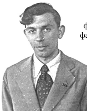
Студент філософського факультету КДУ