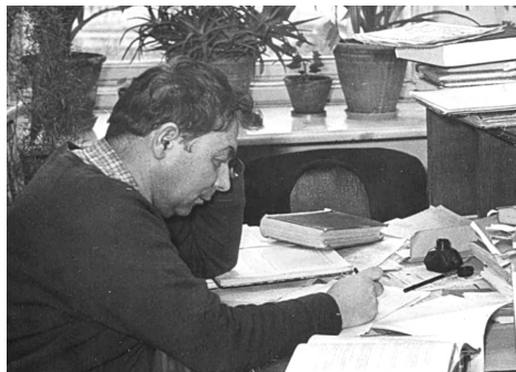
Робота, робота, робота... (в бібліотеці мехмату МГУ)