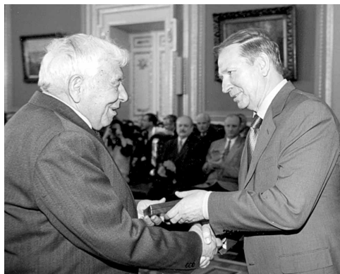
Визнання заслуг (вручення диплому Заслуженого працівника освіти)