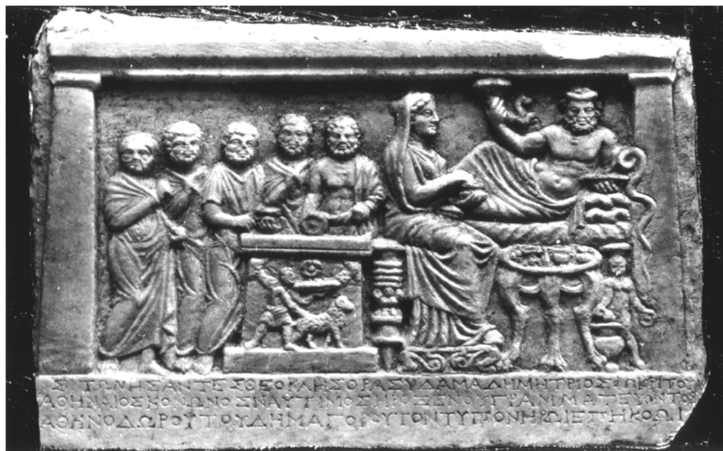
Рис. 2. Стела ситонів. III ст. до н. е. Ольвія.