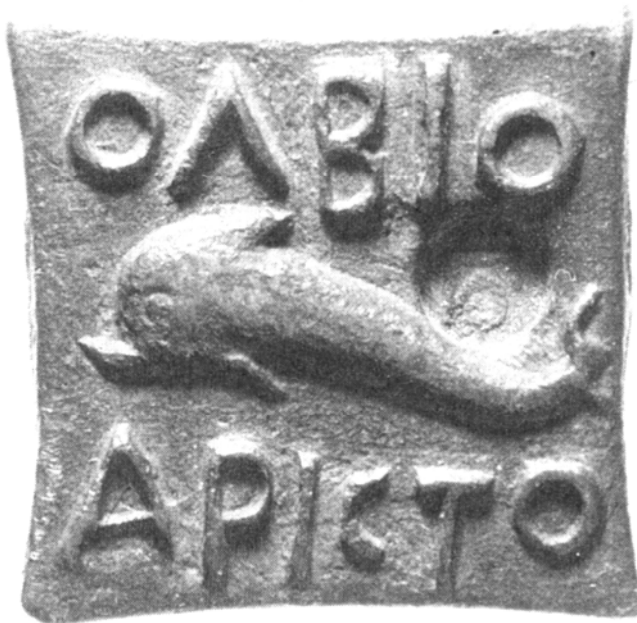
Рис. 1. Ольвійська вагова гиря. IV ст. до н. е.