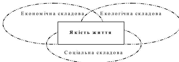
Рис. 1. Складові, що формують якість життя населення

Інтенсивне використання природного капіталу у вітчизняній індустріальній економіці обумовлює не лише зменшення його обсягів, але й високі рівні забруднення довкілля, що негативно впливає на основні соціально-економічні показники. Наприклад, Чорнобильська аварія призвела до масштабних економічних збитків та реалізації багатовитратних програм соціального захисту постраждалого населення, в той час як ці кошти можна було використати на соціально-економічний розвиток. Сьогодні Україна гостро відчуває негативні зміни в екологічній ситуації, що виявляються у підвищенні рівнів захворюваності населення, зростанні випадків інвалідності, насамперед, дитячої, виробничого травматизму і т.д. [2, 3].