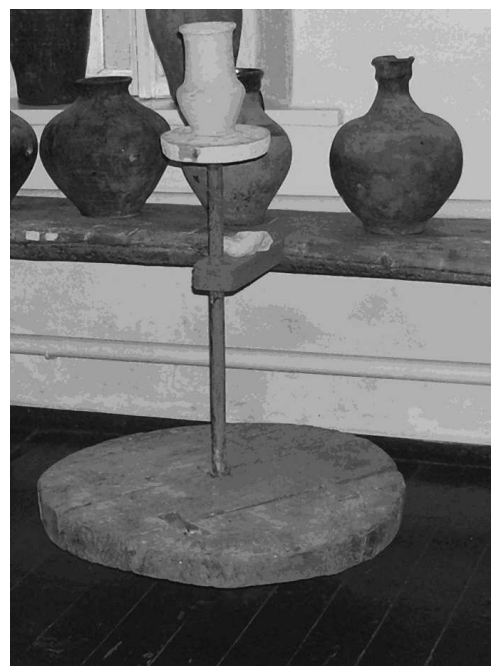
Мал. 7. Гончарний круг 1940-50-их рр. у керамологічній експозиції ІММОП. Пархоменко (Макарів Яр), Луганщина. 17.09.2007.