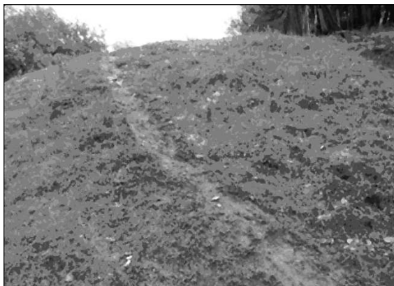
Мал. 11. Місце, де колись було розташоване горно. Пархоменко (Макарів Яр), Луганщина. 14.09.2007.