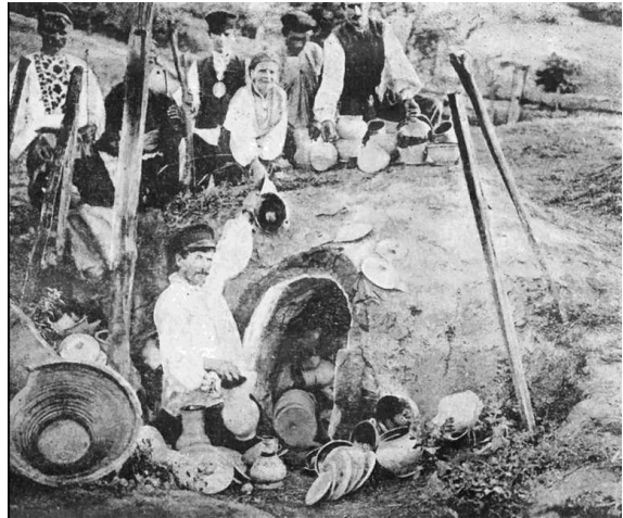
Мал. 9. Розвантажування горна. Катеринославщина. Поч. XX ст. [З кн.: Бабенко В.А. Етнографічний очерк народного быта Екатеринославского края.– Екатеринослав: Типография губернского земства, 1905.– С. 88].