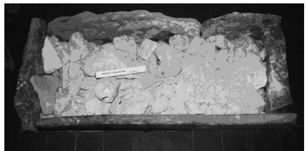
Мал. 4. Яма для зберігання глини (“груба”) (кін. XIX – поч. XX ст.) у керамологічній експозиції ІММОП. Пархоменко (Макарів Яр), Луганщина. 09.10.2001.

но на тиждень 20 . Далі глину лопатою розкладали на посипаній піском долівці, старанно переминали ногами, доки не утворювався глиняний пласт – “корж” 21 . Пісок додавали до жирних глин, які ставали піснішими й виготовлені з них вироби тримали задану майстром форму. Кілька годин поспіль глину також набивали дерев’яним знаряддям – “довбнями” 22 , “долбішечками” 23 в “кучу” висотою до 1 м. Все це потребувало від гончаря неабияких зусиль. Збиту в “кучу” глину перестругували “стругом” (прямим або вигнутим дугою залізним лезом із двома дерев’яними ручками), який прагнули тримати вертикально до долівки. Дану операцію інколи виконували й струною (шматком дроту, на кінці якого нав’язували невеликі ганчірки), але так робити було значно важче, тому пласти, які при цьому відрізали, були тоншими. Ретельно перестругана й пересічена глина містила мінімальну кількість механічних сторонніх домішок.