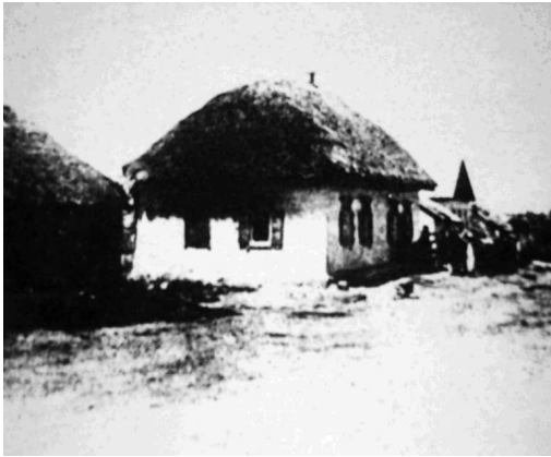
Мал. 1. Хата гончаря Якова Пархоменка. Макарів Яр (нині Пархоменко), Луганщина. 1910-20-ті рр. Автор фото невідомий. ІММОП.