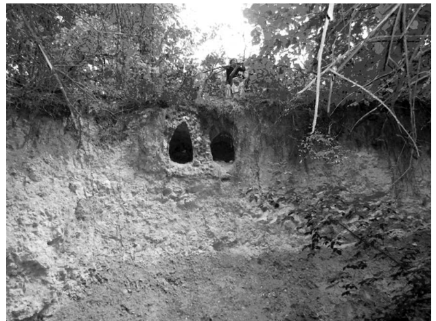
Мал. 10. Залишки гончарного горна кін. XIX – поч. XX ст. на березі місцевої річечки. Пархоменко (Макарів Яр), Луганщина. 13.09.2007.