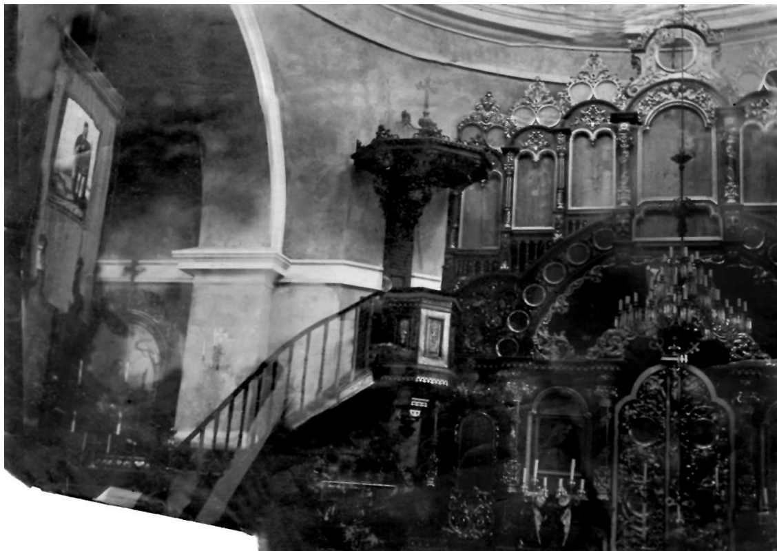
Інтер'єр храму до виконання стінопису. Світлина 1900-их років.