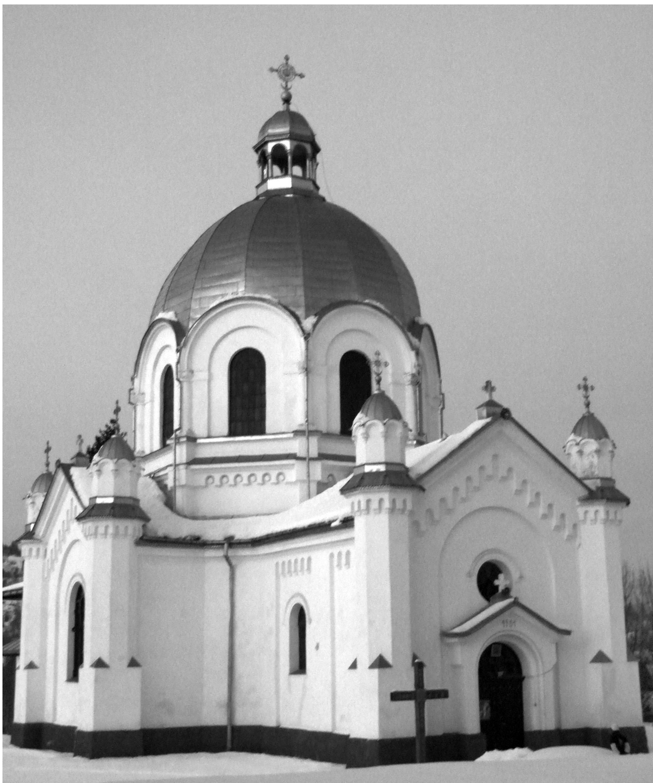
Церква Успія Богородиці в с. Славсько. Фото 2006 р.