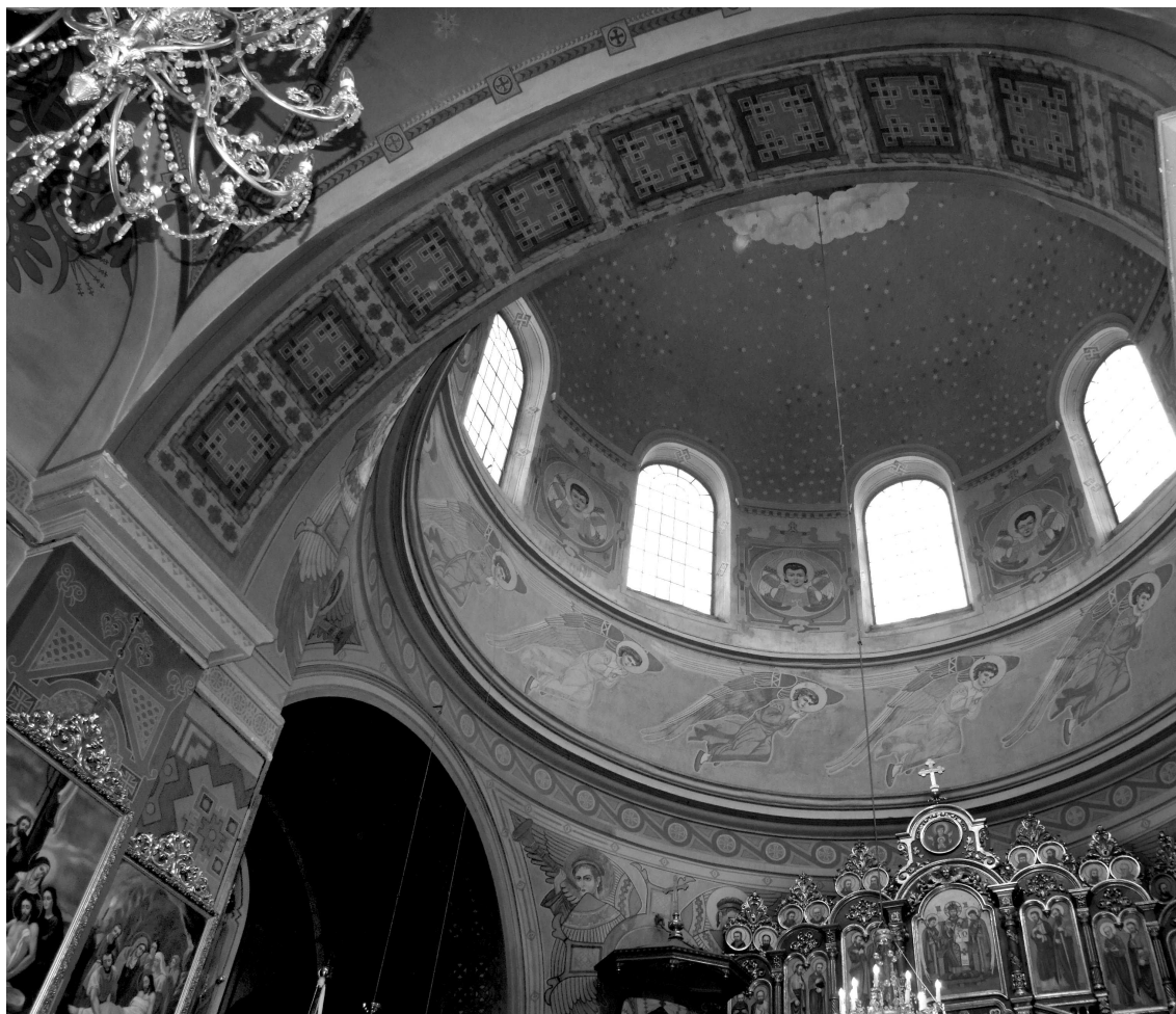
Сучасний розпис купола. Фото 2006 р.