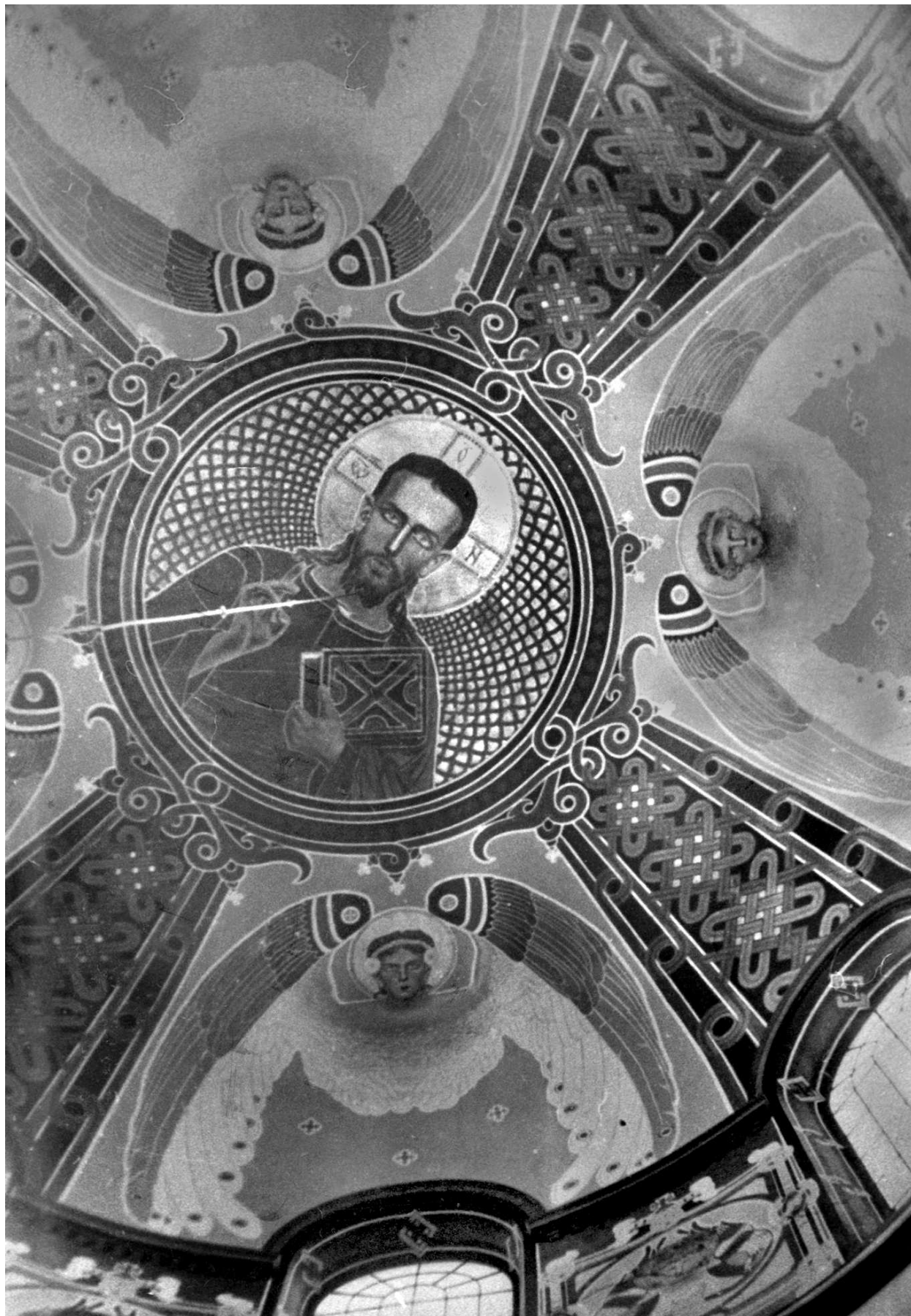
М.Сосенко. Розпис купола храму. Світлина поч. XX ст.