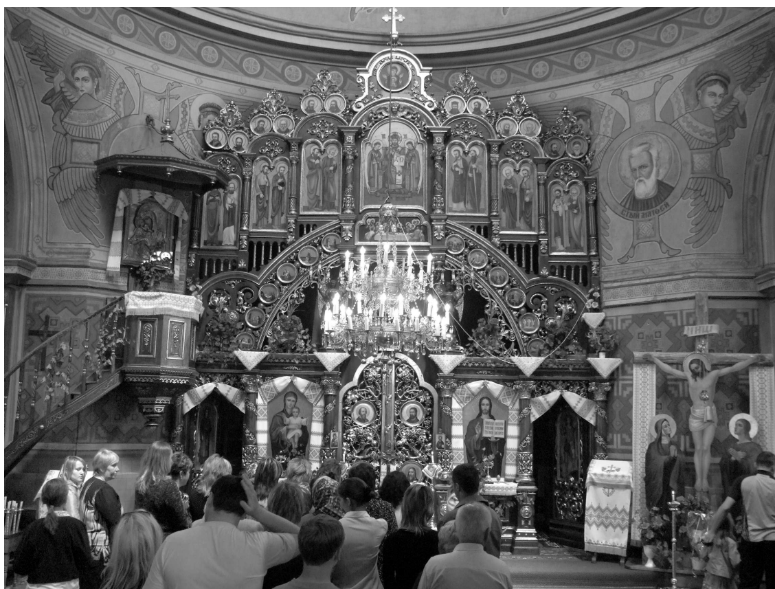
Сучасний інтер'єр храму. Іконостас. Фото 2006 р.