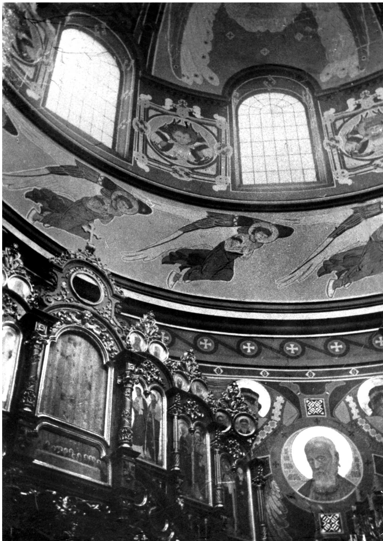
М.Сосенко. Іконостас та розпис центральної частини храму Успія Богородиці в с. Славсько.