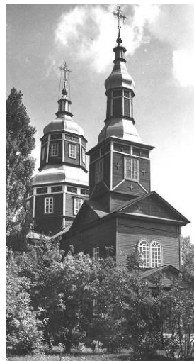
Музей світопізнання та мирного освоєння космосу