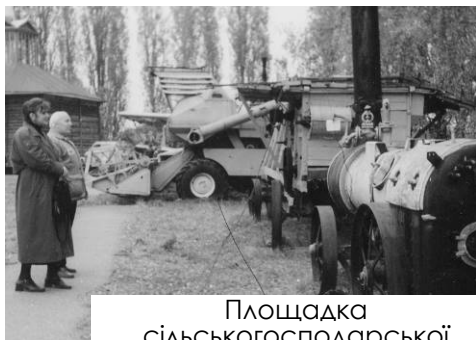
Площадка сільськогосподарської техніки біля Музею хліба