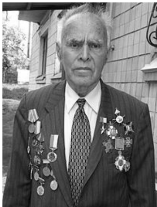
Михайло Іванович СІКОРСЬКИЙ