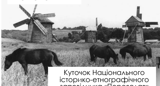
Куточок Національного історико-етнографічного заповідника «Переяслав»