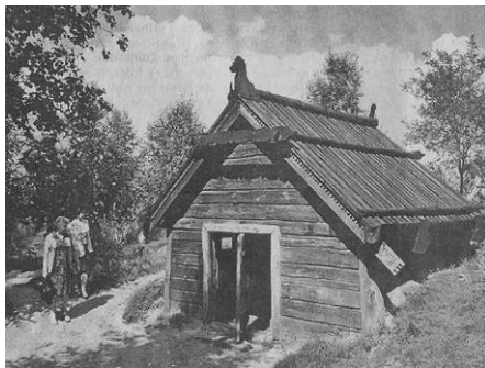
Житло Київської Русі IX ст. (реконструкція)