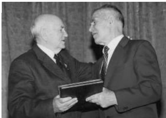
Два Герої України: П.Т. Тронько та М.І. Сікорський