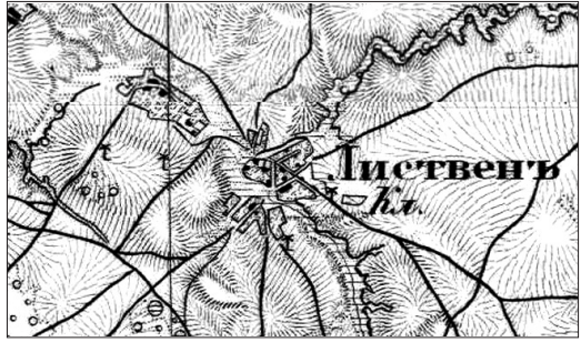
Рис. 2. Планування с. Малий Листвен на мапі середини – другої половини XIX ст.

куточках сучасного села. Це свідчить про активне розростання населеного пункту в цей період. Керамічний посуд та кахлі XVII–XVIII ст. віднайдені у Листвені, аналогічні матеріалам, що походять з Чернігова та Любеча.