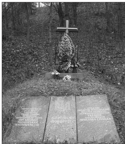
Пам'ятник розстріляним Гестапо у Львові 27.11.1942 р.