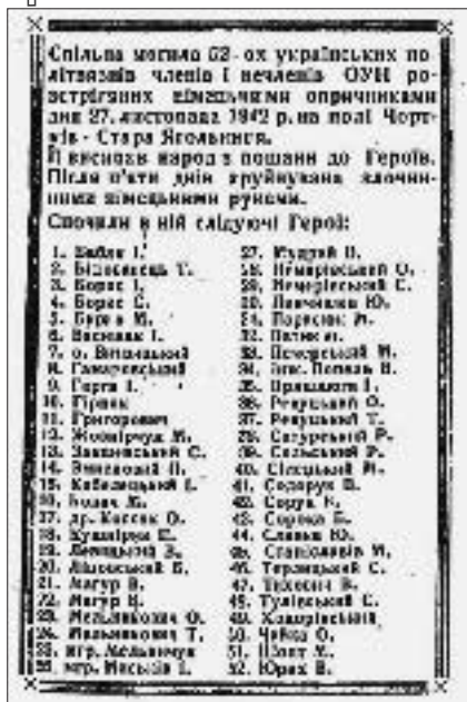
Листівка ОУН(б) із переліком розстріляних 27.11.1942 р. націоналістів (зворотний бік)