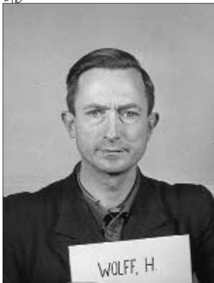
Обер-штурмбанфюрер СС Ганс Гельмут Вольфф на Нюрнберзькому процесі

До початку масових арештів членів ОУН А. Мельника слідчі його не викликали.