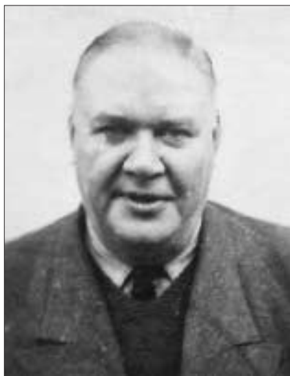
Гауптштурмфюрер СС Вільгельм Вірзінг. 1950 р.

24 січня 1951 р. в м. Нюрнберг-Фюрті у Західній Німеччині відбулося судове засідання у справі гауптштурмфюрера СС Вільгельма Вірзінга. Йому інкримінували участь у 15 допитах, на яких він сам або інші особи за його наказами застосовували тортури. Жертвами цих тортур під час Другої світової війни були українські націоналісти.