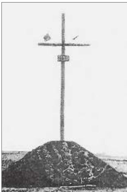
Братська могила націоналістів, розстріляних Гестапо 27.11.1942 р. неподалік Старої Ягільниці